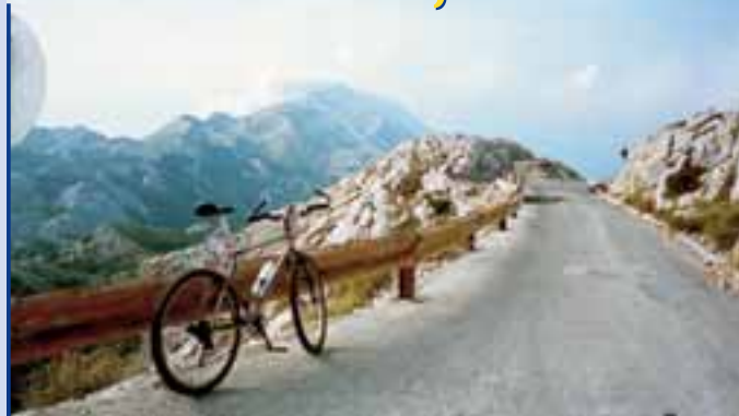
Vrcholová partie přírodní rezervace Biokovo (1750 m n. m.). Nyní vás čeká souvislý třicetkilometrový sjezd k Jaderskému moři.