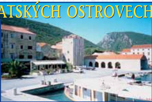
Kamenná městečka v zátokách ostrovů jsou vděčnými a romantickými přístavišti.

Za naprosto unikátní cyklistickou záležitost pak považují poslední den sportovního programu, kdy se, již na pevnině, vyjíždí do pohorí Biokovo na jeho nejvyšší vrchol sv. Jure. Je totiž jen málo míst v Evropě, kde vás čeká 30kilo-