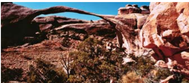
Zase téma mosty: jeden kamenný, USA Archers N.P., druhý slavný Harbour Bridge Sydney