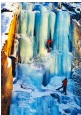
Bliží se zima: TAK LEDOPÁD U LIBERCE, jak vidno není nutné cestovat do Alp nebo na Aljašku.