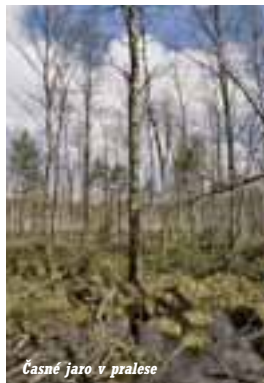
Časné jaro v pralesě

chrupu. Vlčí stezka vás povede pralesem, ukáže vám bažinaté olšiny s příměsí břízy (evokující severský dojem tajgy), dovede vás ke skanzenu lesní železnice, kterou zde za první světové války vybudovali Němci (železnice měla 130 km kolejí stálých a 200 km přenosných). Turistická stezka vás nakonec vyvede z pralesa (na jehož okrajích se můžete setkat i s impozantními ptáky – jeřáby popelavými) do vsi Babia Góra (kde podle polského úsloví – „dává dábel dobrou noc“).