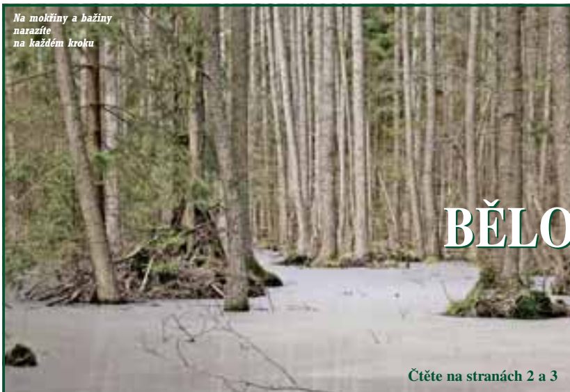
Na mokřiny a bažiny narazíte na každém kroku