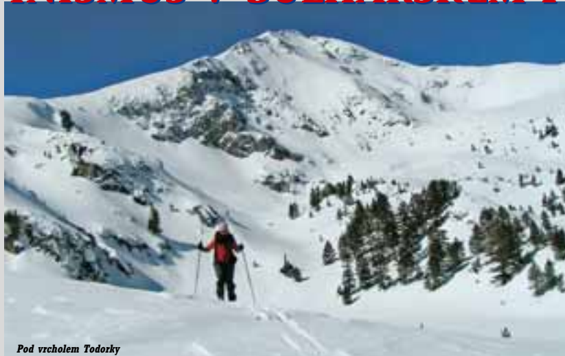
Pod vrcholem Todorcy