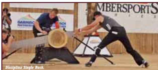
Disciplína Single Buck.

To se jim podařilo, protože v tvrdé konkurenci skončili na 4. místě a nechali za sebou silné týmy z Německa, Španělska i Holandska. Chybělo velice málo, celkově 1,5 sekundy, aby náš tým získal bronzovou medaili. Na prvních třech místech se umístila družstva z Francie, Velké Británie a Švýcarska.