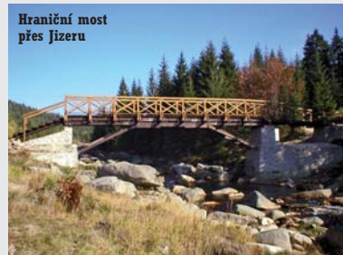
Hraníční most přes Jizeru

nici nejen z celých Čech, přilehlých oblastí Horní Lužice, Dolního Slezska, ale i z Prahy, Drážďan či Berlína. A právě zde vznikla na samém počátku 20. století nejslavnější a nejdělsí hřebenová cesta – Modrá Hřebenovka – spojující v době své největší slávy jednotlivé horské hřebeny od nejvy-