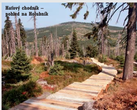
Hávořský chodník – pohled na Holubník

Již před sto lety bylo dnešní území Libereckého kraje považováno za turistický ráj, do kterého kvůli odpočinku a poznání přijížděli návštěv-