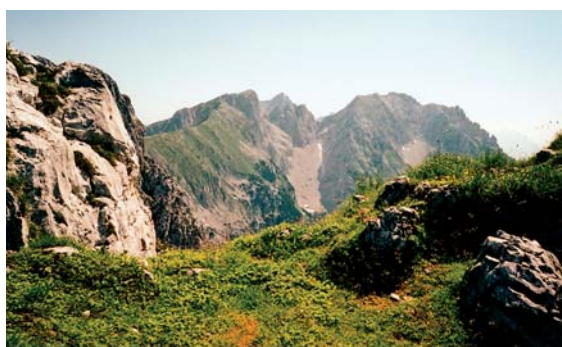
Pohled od Scheffaueru (2111 m) v západním Kaiseru směrem na východ