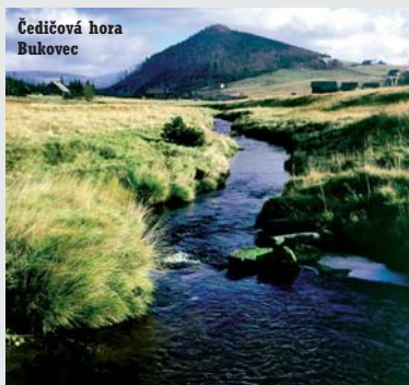
Čedišová hora Bukovec

Pojďte a na chvíli se vraťte do časů, kdy se turisté po našich horách pohybovali pěšky s rozvahou po kamenitých cestách, pozorovali krásy krajiny z vyhlídek s kovaným zábradlím nebo z kamenných rozhleden a svoje dojmy z cest si vyprávěli v dřevěných horských šencích, které voněly peřínkou, koženými botami, petrolejovými lampami, koňmi a senem.