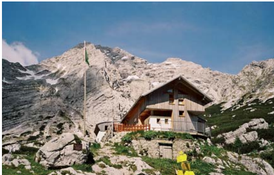
Chata Alpenvereinu Heshütte pod masívem Hochtortu

Ennstalské Alpy patří k turisticky méně známým, o to však zajímavějším skupinám severních vápencových Alp. Tvoří je několik vápencových masívů, oddělených koryty horských říček, z nichž nejvýznamnější je hluboký kaňon známé vodácké řeky Enns. Mohutné vápencové masívy neohromí absolutní nadmořskou výškou (nejvyšší horou pohoří je Hochtort (2369 m), ale jejich kolmé stěny působí při pohledu z údolí impozantně a divoce. Část Ennstalských Alp podél Ennsu spadá pod národní park Gesausee.