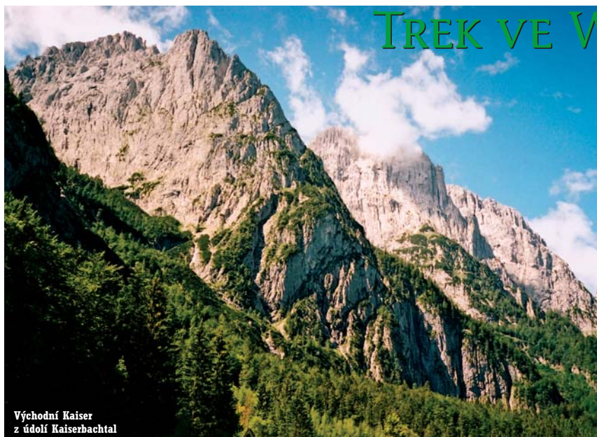
Východní Kaiser z údolí Kaiserbachtal