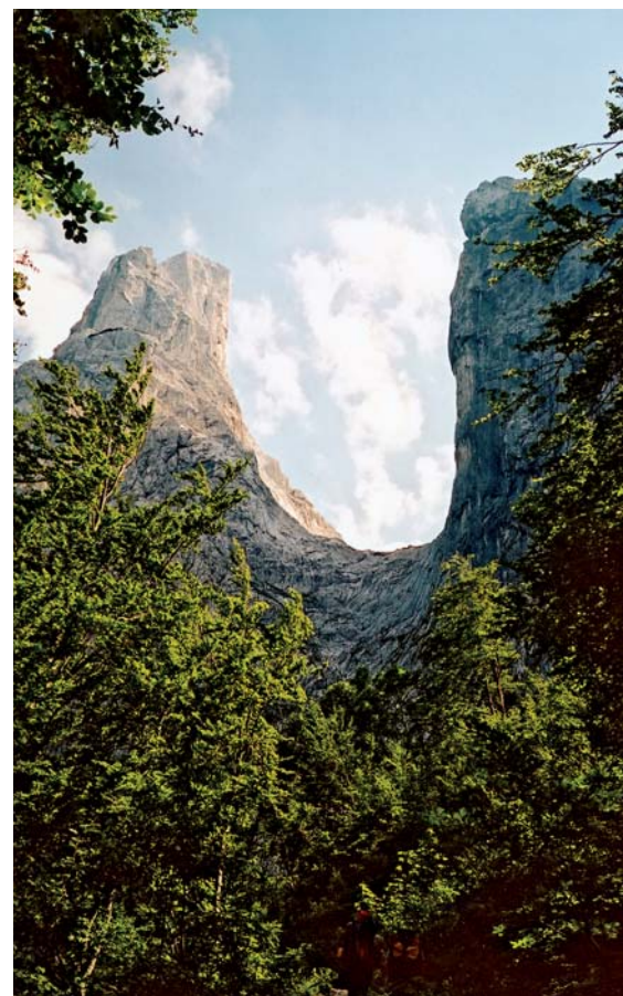
Wilder Kaiser nabízí četná přechodová sedla pro trek