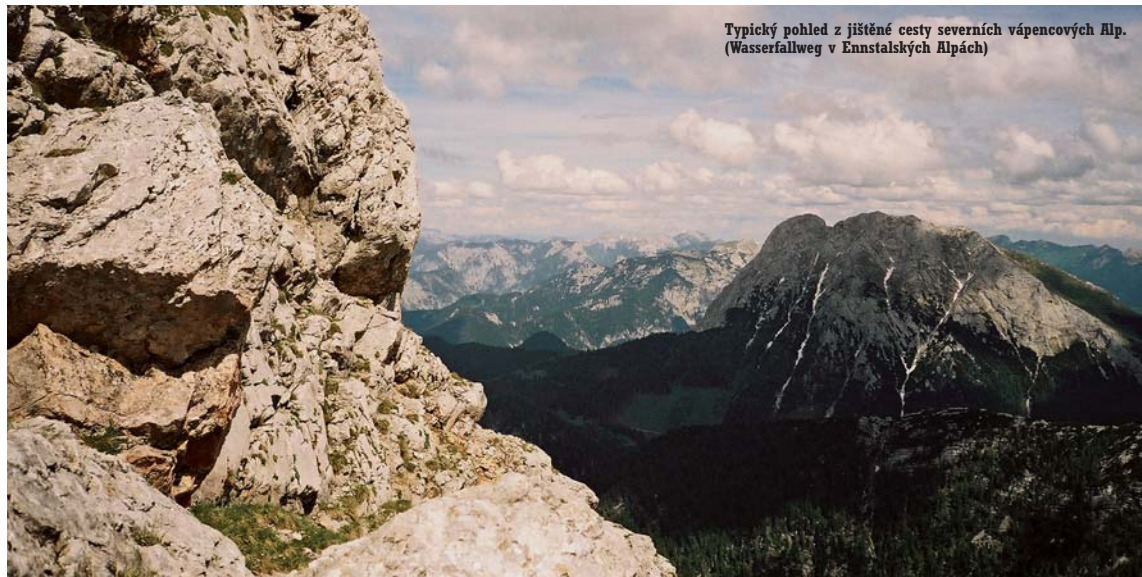
Typický pohled z jištěné cesty severních vápencových Alp. (Wasserfallweg v Ennstalských Alpách)

jednotlivých vesniček jezdí pravidelně autobusové spoje.