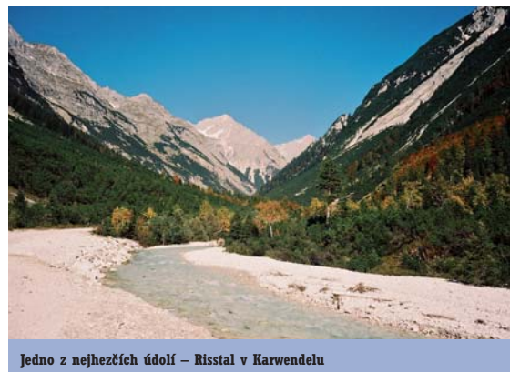
Jedno z nejhezčích údolí – Rissal v Karwendelu

Malebnost hor, kromě divokých říček na jejich úpatích, násobí i četné vodopády stékající z jejich srázů. Výstupové cesty vedou většinou podél nich. V pohoří najdeme i řadu národních parků, z nichž