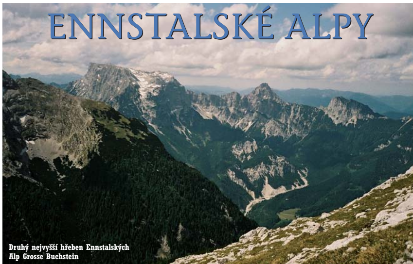
Druhý nejvyšší hřeben Ennstalských Alp Grosse Buchstein