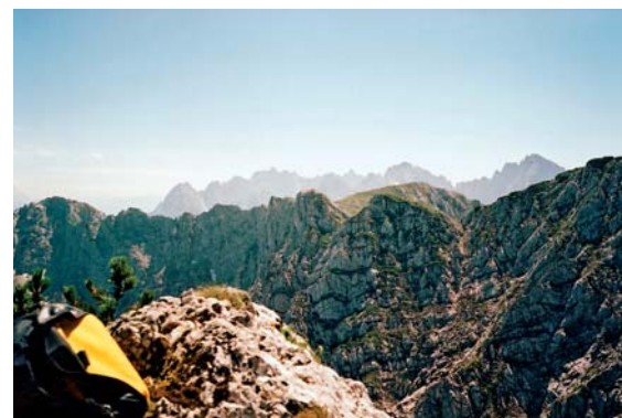
Kotel Zahmer Kaiseru. V dáli hřeben Wilder Kaiseru.