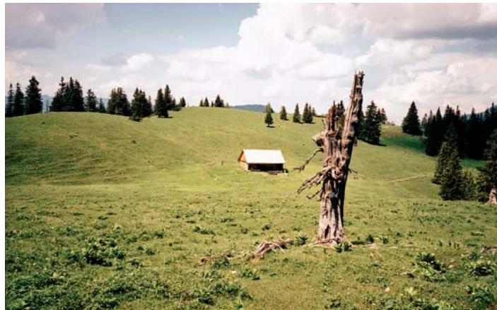
Západní Hochschwab je plošinou plnou zeleně (salaš ve výšce okolo 1600 m)