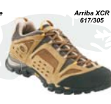
Arrbra XCR 617/305