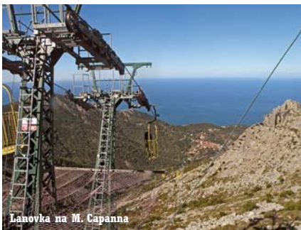
Lanovka na M. Capanna