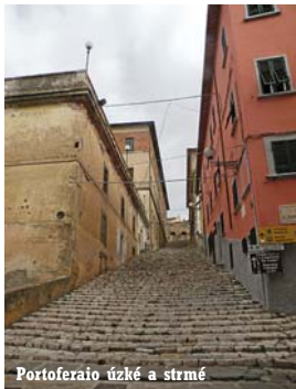
Portoferario úzké a strmé

Mizím také, i když pomaleji, k nejbližšímu pobřeží a snad jediné minipláži. Je sice kamenná, ale není na vybranou. Metrová vlna běží ke břehu tak rychle, že se nedá vymyslet nic, než se na ní udržet a pořádně zabrat, aby se před kajaku dostala co nejdlá na pevnou půdu. Pak nejvyšší možnou rychlostí strhnout špricku a vyskočit do vody. Přistí vlna je nemilosrdná a udeří plnou silou do balancujícího kajaka. Předtím ale povětšinou naplní kajak tak, aby byl co nejtěžší a doprava na břeh co nejobtížnější.