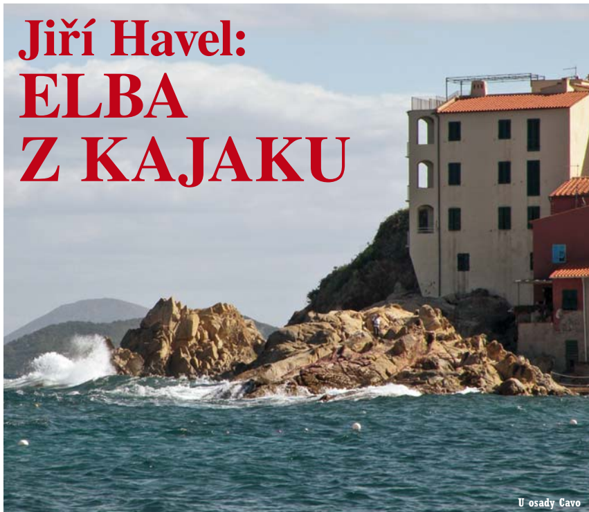
U osady Cavo