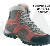
Suiterra Suede W'S GTX 616/240