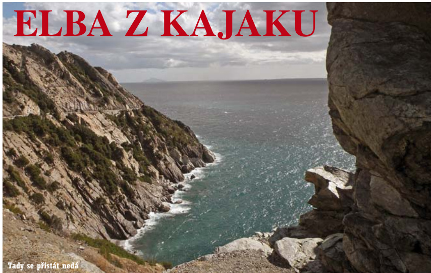
Tady se přistát nedá

Rybář z malé vesničky St. Andrea loví ryby zajímavým způsobem. Malý motorový člun bublá na minimální otáčky, loďka má kormidlo fix a točí se v nepravděpodobně krutá střeža dokola. Loďdové se o loďku nekurá, protože má hlavu ponořenou v jakési bezedné válcové nádobě, připravené k boku