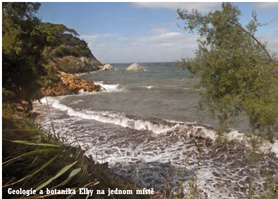
Geologie a botanika Elby na jednom místě