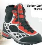
Spider Light GTX 169/196