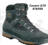
Conero GTX 878/058