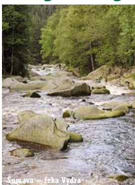
Šumava – řeka Vltava

Druhá letní etapa Monitoringu domácího cestovního ruchu agentury CzechTourism ukazuje, že roste význam poznávací turistiky jako hlavního důvodu návštěvy v regionech. Jako nejdůležitější informační zdroj označily dvě třetiny ze 26 tisíc respondentů z celé České republiky internet. Nejspokojenější ze všech byli ti, kteří navštívili Šumavu.