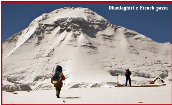
Dhaulagiri z French passu