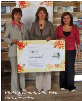
Předání symbolického šeku starostce města

Pořadatelem je společnost Unilever ČR, spol. s r.o. a jejími partnery bylo Ministerstvo dopravy, Centrum dopravního výzkumu, Státní fond dopravní infrastruktury, Svaz měst a obcí, Národní sít Zdravých měst, agentura CzechTourism, Nadace Partnerství a občanské sdružení Na Kole.