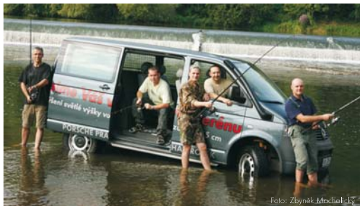
Vyobrazení ukazuje Transporter Kombi 2,5 TDI 4MOTION® s provedenou úpravou SEIKEL pro jízdu v terénu.

Dešť, sníh, štěrka: každá cesta, každá trasa má svá vlastní úskalí. Máte-li pohon 4MOTION®, nemáte problémy. Inovativní pohon všech kol 4MOTION® zajišťuje optimální přenos síly a jízdní vlastnosti - na špatných cestách i při špatném počasí, v zatáčkách i při akceleraci. Už při sebemenším prokluzu kol zareaguje a rozdělí hnací sílu na jednotlivá kola podle možnosti trakce. Senzory sledují jak řízení, tak řídicí elektroniku motoru, brzdy a převodovku. Ke korekcím tedy dochází ve zlomcích sekundy. 4MOTION® ve spojení s ABS (protiblokovací systém), EDS (elektronicky řízená uzávěrka diferenciálu) a ESP (elektronický stabilizační program) znamená nejvyšší možnou míru bezpečí. Transporter s pohonem 4MOTION® připomíná i další užitečné vlastnosti, například nízkou výšku pro nastupování a dobře přístupnou nákladovou plochu. Na Vás je už jen jedině: jak se vhodně obléci, když Transporter opouštíte.