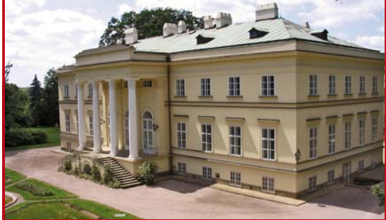
Zámek Kostelec nad Orlicí

Díky poloze na řece Orlici je území rájem pro vodáky. Na úseku Divoké Orlice z Kostelce nad Orlicí prolupávají vodáci v příjemně lučinaté krajině, řeka místy meandruje, a mohou se nechat unášet dolů po proudu až k soutoku s Tichou Orlicí. Dále je možné pokračovat majestátním tokem Spojené Orlice, širokými meandry směrem k Hradci Králové. Díky stále rostoucímu zájmu vodáků o řeku Orlici si nechalo Město Kostelec nad Orlicí a další partneři na toku této řeky zpracovat projekt Vodácká řeka Orlice, který by měl v budoucích letech vodákům usnadnit cestu po řece Orlici pomocí směrůvek, ukazatelů, nástupních a výstupních míst, popř. další doprovodné infrastruktury.