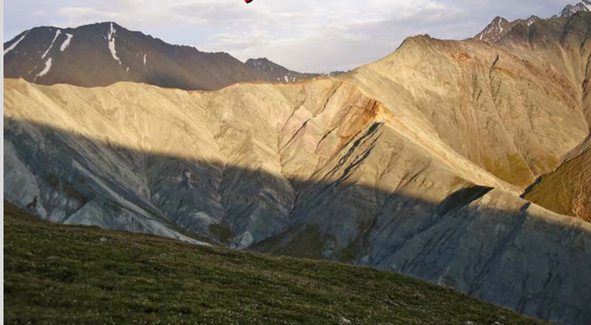
Pohled do doliny Jarlu při západu slunce

ke, což je kozorožec – asi se sem chodilo dřív na lov těchto zvířat, která se tu pořád vyskytují). Tady je už lidí mnohem méně, za dva dny jsme viděli pouze v dálece dvě postavy. Byli to nejspíš pastevci koní.