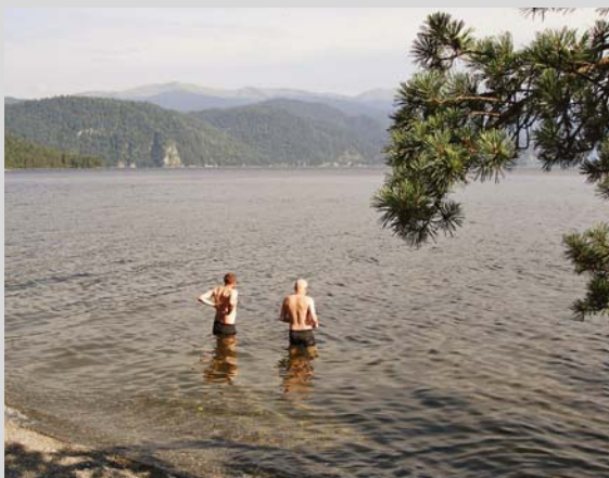
Tělečné jezero – voda byla fakt ledová

nejdříve se jde údolím řeky Akkem k jezeru Akkem. Zde je docela dost lidí (převážně Rusů), neb je to přístupová cesta k Uč Sumeru (Bélucha). Na jezeru jsme použili další dopravní prostředek, lodní přívoz. Pak se jde dolinou Jarlu, která je velmi zvláštní. Dělí se o ni totiž hned dvě ruské náboženské skupiny, uctívající zde jeden velký kámen (ne-