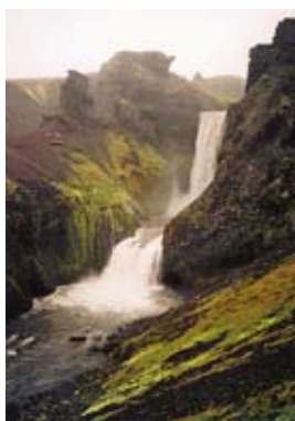
Jeden z četných kaskádovitých vodopádů nad vodopádem Skógafoss.

Island leží v oblastech bohatých na srážky. Je to navíc hornatá lávová krajina s četnými ledovci, takže není divu, že jeho řeky jsou prudké a vodnaté, i když pochopitelně nijak neohromují svoji délkou. Nejdelší z nich – Pjórsá – je dlouhá jen 230 kilometrů. Voda vyhloubila v četných údolích i řadu bizarních kaňonů a ostrov má i svůj „Grand Canyon“, jímž protéká řeka Jökulsá a Fjöllum. Rafting je ostatně jednou z rozvíjejících se turistických aktivit a je místními agenturami nabízen na několika řekách.