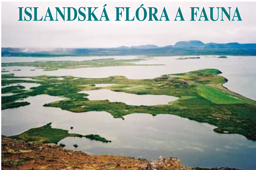
Kouzelné jezero Mývatn na severu Islandu je jedním z největších ostrovních hnízdišť ptactva. V jezeru je řada pseudokráterů vzniklých výbuchy plynu poté, co do něj natekala láva z okolních sopek.