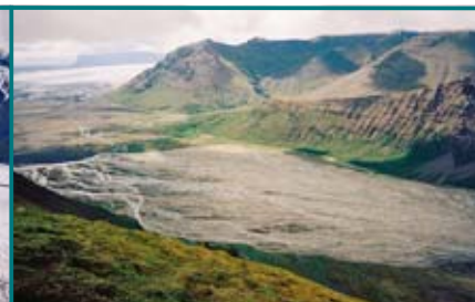
Tímto divokým ledovcovým údolím se přehnaly hlavní záplavy z výbuchu sopky pod Vatnajökullem v roce 1996.