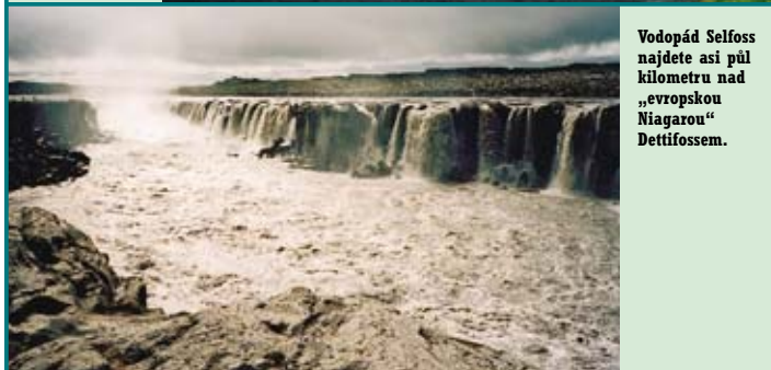
Vodopád Selfoss najdete asi půl kilometru nad „evropskou Niagarou“ Dettifossem.