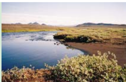
Brod v islandském vnitrozemí. Rady k dopravě po ostrově najdete na straně 7