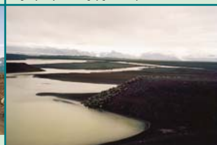
Sandur, fantastická krajina sopečných a ledovcových naplavenin na jihu Islandu. Je protkána deltami řek a dosahuje šíře několika kilometrů.