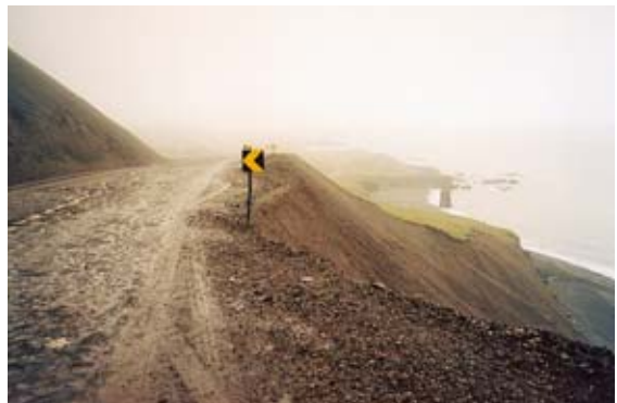
Typická podoba okružní silnice na východě a severovýchodě Islandu. Pokud přejí, je to pro cykloturisty, ale i auta bez pohonu čtyř kol, tvrdý oříšek.

Místní autobusová doprava je poměrně hustá, ale zvláště, když se jedná o terénní autobusy směřující do vnitrozemí, také velice drahá. Zpáteční lístek na 40kilometrovou jízdu s překonáním několika brodů přijde i na tisíc českých korun. Počítejte také s tím, že jízdní řád zde není svatý a nějaká ta deseti minutovka či hodinka zpoždění nikoho nevrzuje. Stop je dosti nespolehlivý.