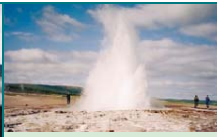
Sttökkur (Tlouk na máslo) je bezprostřední soused slavného Geysiru. Tento gejzír, který chrlí vařící podzemní vodu až do výšky 60 metrů, je nyní aktivní velmi sporadicky, a tak jej Sttökkur u turistů nahrazuje. Chrlí zhruba každých deset minut do výšky 20 metrů.