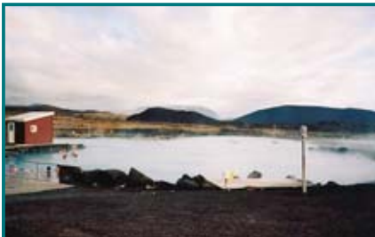
Typické termální koupaliště. Voda v koupací nádrži musí být většinou předem zchlazena, jinak hrozí opaření koupajících.

Pokračující pohyb zemských desek přináší nové a nové výbuchy řady sopek na ostrově. Desky se od sebe oddělují zhruba v polovině ostrova (směrem sever–jih, s jedním odbočným zlomem směrem k Reykjavíku a na poloostrov Reykjanes). Právě v této oblasti se nachází řada činných sopek. Mnohé z nich vybuchly naposledy před desítkami či stovkami let, což je z geologického hlediska nepatrná doba. Obří výbuchy sopek jako Hekla, Askja nebo Krafla jsou světoznámé. Hekla byla ve středověku považována za vstup do pekla a nadávka „jdi do Hekly“ byla největší urážkou. Vybuhne zhruba jednou za deset let. Obří výbuch Askji v roce 1875 (je považován za jeden z největších zaznamenaných sopečných výbuchů na světě) vynesl sopečnou hmotu do výše deseti kilometrů. Sloup byl vidět až ve Stockholmu a sopečný prach pokryl i ulice Moskvy. Askja od těch dob explodovala několikrát a i dnes je povrch jejího obrovského, 50 kilometrů čtverečních velkého kráteru, teplý. V sopečné oblasti Krafla je vulkanická činnost vidět na každém kroku a další výbuch se očekává v nejbližších letech. Pohyb v těchto oblastech je tedy svého druhu adrenalinovým sportem, při němž opatrnosti není nikdy nazbyt.