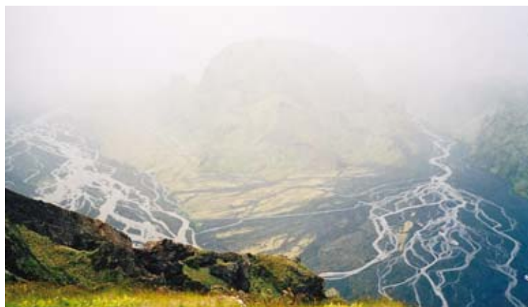
Gothaland (Země bohů), divoká horská krajina pod jihoislandskými ledovci Mýrdalsjökull a Eyjafjallajökull je zahalená do dosti typického mlžného oparu.