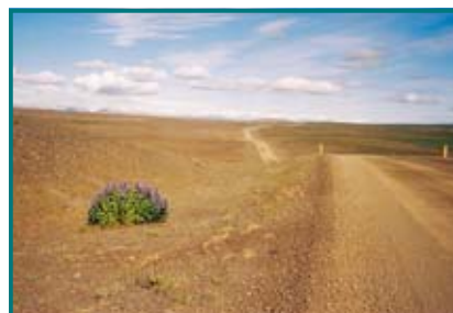
Vnitrozemí Islandu tvoří ve velké většině pouště a polopouště.