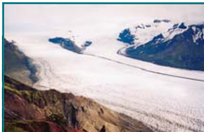
Jeden z četných splazů největšího islandského ledovce Vatnajökull. Vpravo masív nejvyšší islandské hory.

Již název Island napovídá, že by to měla být země ledu, ale ledovce pokrývají jen kolem 12 procent území. Zbyly zde čtyři větší ledovce s plochou nad 500 kilometrů čtverečních a řada malých. Samotnou kapitolou je ovšem ledovec Vatnajökull na jihovýchodním pobřeží země. Svoji plochou 8300 kilometrů čtverečních je po antarktickém a grónském třetím největším ledovcem na světě. Jeho šířka dosahuje 400 metrů. Jelikož jeho západní část leží v oblasti tektonického zlomu, je pod ním několik činných sopek. To vytváří velice nebezpečnou situaci. V roce 1996 jedna ze sopek vybuchla, což bylo zaznamenáno. Farmáři v okolí začali stavět hráze a připravovat se na záplavy. Měsíc se však nedělo nic a vypadlo to, že se vše uklidnilo. Po měsíci však ledový příkrov pod náporom vařící vody doslova vybuchl a následující záplavy propláchly přilehlá údolí a zdevastovaly zemědělské usedlosti, okružní silnice i četné mosty. Pokroucené železobetonové konstrukce mostů a mnohaletově připravené balvány jsou na pobřeží vidět dodnes.