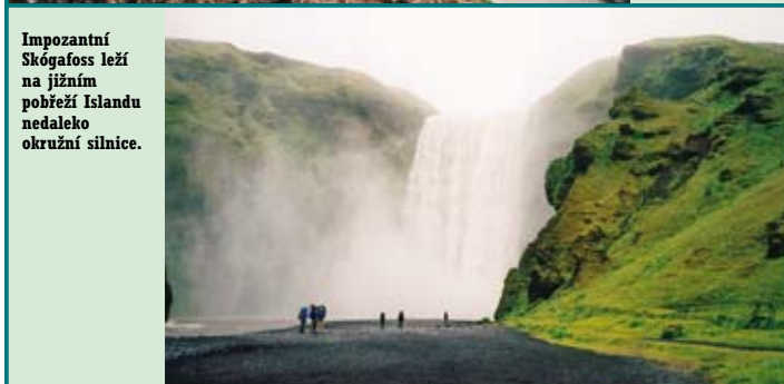
Impozantní Skógafoss leží na jižním pobřeží Islandu nedaleko okružní silnice.