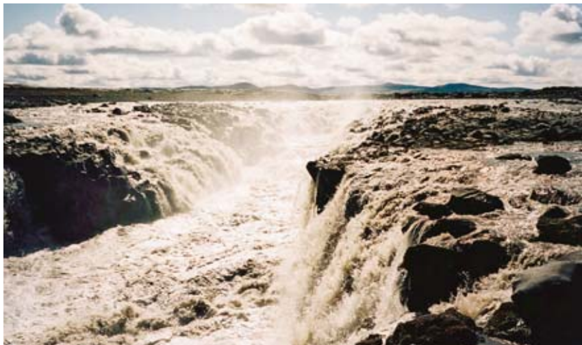
Typický skokový vodopád na řece Jökulsá ã Fjöllum. O úžasných islandských vodopádech a řekách více na straně 6