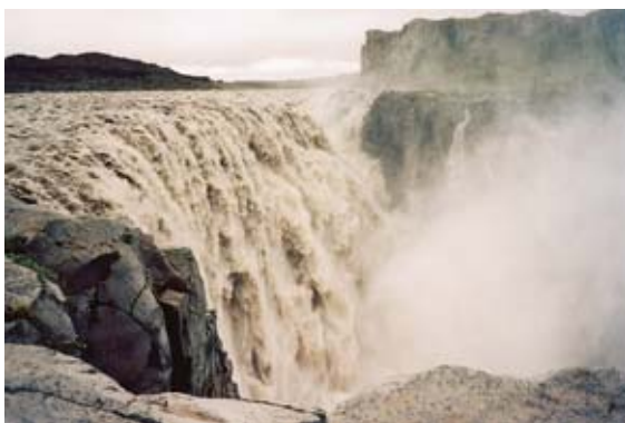
Největší evropský vodopád Dettifoss leží v pouštní krajině v kaňonu řeky Jökulsá a Fjöllum na severovýchodě Islandu. Působí impozantně až hrozivě. Je vysoký 44 metrů a protéká jím 500 metrů krychlových vody za vteřinu.