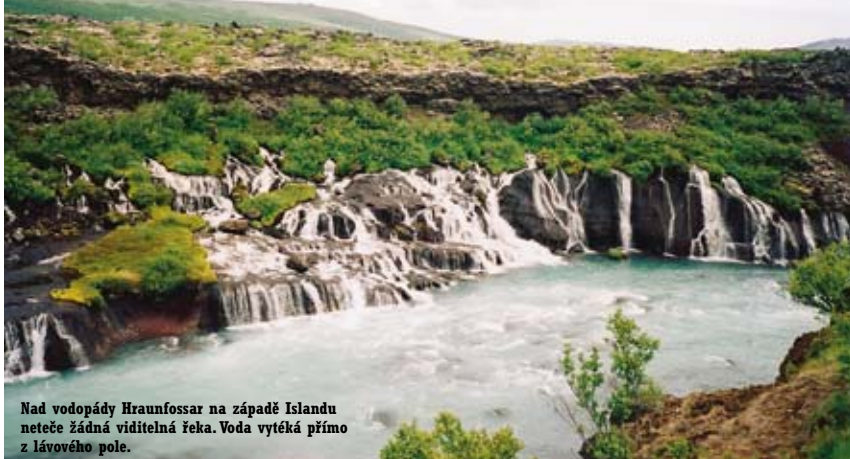
Nad vodopády Hraunfossar na západě Islandu neteče žádná viditelná řeka. Voda vytéká přímo z lávového pole.