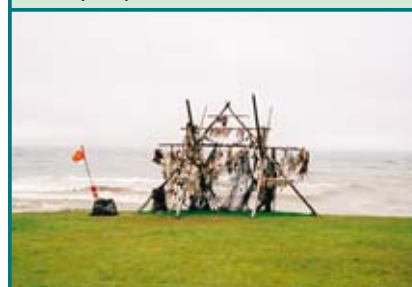
Rybolov patří odjakživa k hlavním způsobům obživy Islandanů. Sušené ryby jsou k dostání všude.