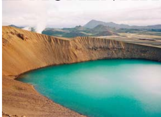
Kráter Viti v sopečné oblasti Kraflay nedaleko jezera Mývatn. Viti již není aktivní, další výbuchy Kraflay se však očekávají. O islandských sopkách si můžete přečíst na straně 3

Island je pro dobrodruhy a romantické cestovatele zemí zaslíbenou. Tento ostrov v severním Atlantiku, jen o málo větší než Česká republika, má pouze dvě chybičky na kráse – je jedním z nejdražších míst na zemi a je zde velmi nestálé počasí. Když se s tím duševně i prakticky vyrovnáte, můžete s klidem vychutnávat neuvěřitelně bohatou přírodu.