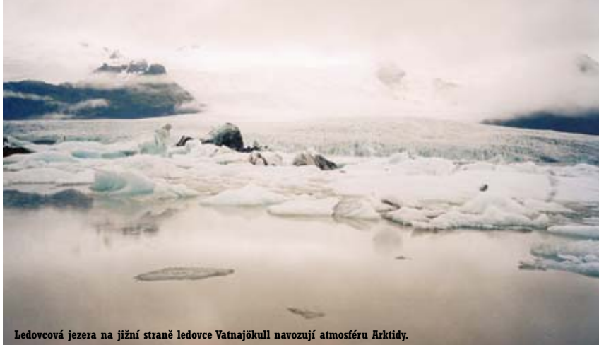
Ledovcová jezera na jižní straně ledovce Vatnajökull navozují atmosféru Arktidy.

Až na několik nížin při ústích řek do oceánu pokrývají celý Island hory. Někde mají velehorský ráz (zvláště na jihu a jihovýchodě), jindy charakter náhorních planin, z nichž vystupují jednotlivé hřbety, sopečné kužely nebo stolové hory. Islandské hory doslova hýří barvami. Různá pohoří mají různé barvy a četné hory připomínají malířskou paletu – je to geologický ráj.