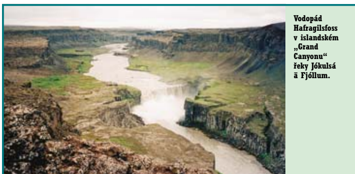
Vodopád Hafnagilsfoss v islandském „Grand Canyonu“ řeky Jökulsá a Fjöllum.