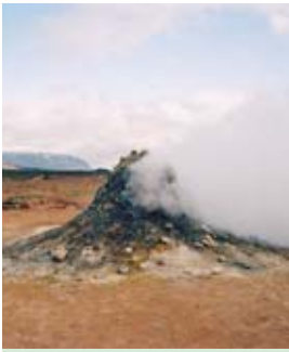
Kouřící sopouchy a bublající jámy jsou obvyklými jevy na četných islandských solfatárech.