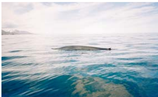
Hřbet modré velryby, která zavítala k břehům severního Islandu.