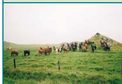
Koně jsou na ostrově u většiny vesnických usedlostí. Islandský kůň je robustní a malého vzrůstu.