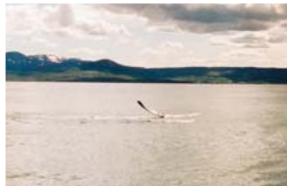
Islandské pobřežní vody jsou rájem pro pozorování velryb. K ostrovní flóře a fauně více na straně 4

Island je natolik výjimečnou a pro dobrodruhy přitažlivou zemí, že mu věnujeme celé toto číslo našeho časopisu. Popsat by se o něm daly jistě stohy papíru – ostatně jsou již popsány. Vždyť u nás lze koupit hned několik průvodců v češtině a tento jazyk je mezi turisty na ostrově jeden z nejčastějších. Proto jsme pro inspiraci vybrali jen několik stránek islandské přírody a života a doplnili je radami pro nezávislé cestovatele. Vše najdete na stranách 2–7 dnešního Dobrodruha.