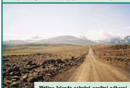
Většinu Islandu pokrývá pouštní náhorní plošina, z níž vystupují hory, hřbety a ledovce. V pozadí ledovec Langjökull (953 km 2 ) na západě ostrova.