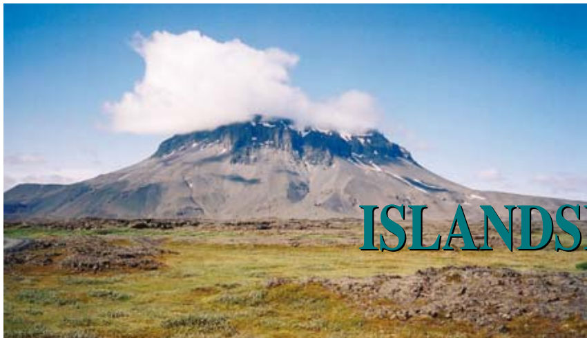
Stolová hora Herdubreid (1682 m n. m.) ve vnitrozemí východního Islandu byla v internetovém hlasování Islandanů zvolena za nejkrásnější horu země. O islandských horách a ledovcích čtěte na straně 2