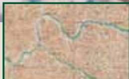
Ukázka jediné dostupné mapy do hor, docela nepodrobná, měřítko 1:300 000.

V horách jsem strávila čistého času měsíc, s jednou malou přestávkou, kdy bylo nutné doplnit zásoby potravin. Pohyb byl nesnadný „vpadatě“ jen na začátku, než jsem se dostala na hřeben. Od hřebene mě totiž dělilo pásmo mechovo-lišejníkové modřínové tajgy, což v překladu znamená, že se při každém kroku propadnete do padesáti měkkých centimetrů. Zkusila jsem samozřejmě taktiku proti proudu horských bystřin, ale problém byl, že boční přítoky měly příliš silný proud, než aby se daly přebrodit. A následovat jiný přítok zase znesnadňovaly například vodopá-