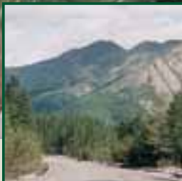
Takto vypadá magistála – jediná a hlavní „silnice“ vedoucí směrem na Magadan, ona „Cesta stavěná na kostech“ vyhnanců na Sibiř. V okolí hory Verchojanského Chrebetu.

dy. Musela jsem tedy zkusit projít tajgou direktem nahoru. Hřbet je skalnatý, travnatý, suťový, nebo porostlý kosodřevinou, a bez vody. Pro tu jsem tréninkově běhala každé ráno a večer nějakých 300–400 výškových metrů dolů. Průměrná nadmořská výška vrcholů v oblasti, kde jsem se pohybovala, nepřesahovala 2000 m n. m. Orientace? Velmi hrubě podle map, spíše jsem šla stylem pokus–omyl. Prozkoumávání možné cesty bez batohu (to víte, s 30 kg na zádech se neběhá tak lehce) a posléze pokračování s ním. Z řadových tvorů převažovali divocí sobi a bu-