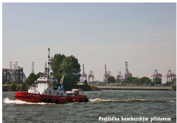
Projížďka hamburským přístavem