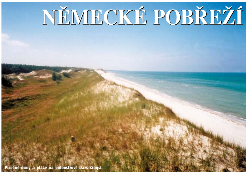
Písčité duny a pláž na poloostrově Dars-Zingst