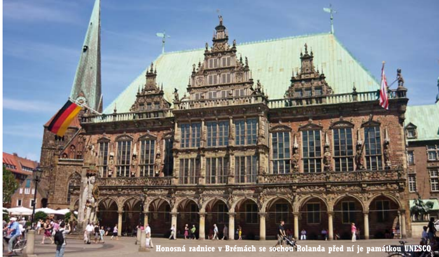
Honosná radnice v Brémách se sochou Rolanda před ní je památkou UNESCO

četných nudistických „FKK“ pláží. A to v době, kdy i na mnohem liberálnější Západě znamenalo veřejné opalování „nahofe bez“ společenskou provokaci.