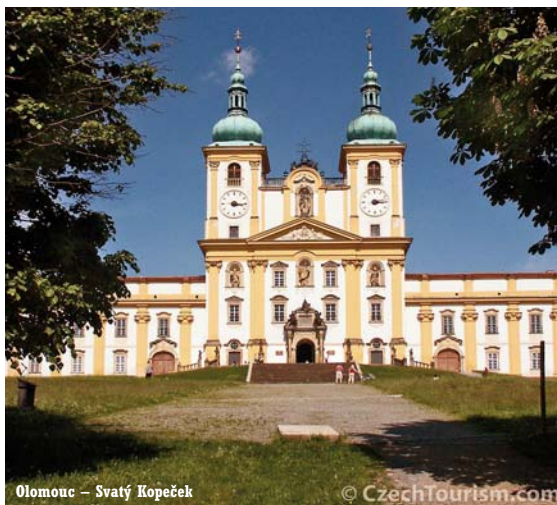
Olomouc – Svátý Kopeček