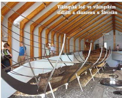
Vikingská loď ve vikingském sídlišti a skanzenu u Šlesviku