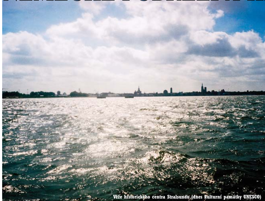
Věže historického centra Stralsundu (dnes kulturní památky UNESCO)

Nebýt Druhé světové války, mohl patřit sever Německa s jeho písčným pobřežím a výstavními historickými hanzovními městy ke klasickým evropským poznávacím okruhům. Takovým, jako jsou třeba francouzská Provence, italské Toskánsko nebo španělská Andalusie. Masivní bombardování velkých německých měst, územní změny, rozdělení pobřeží železnou oponou a averze vůči německé politice ve 30. a 40. letech však tuto historickou oblast odsunuly na dlouhá desetiletí na okraj zájmu cestovatelů a turistů.