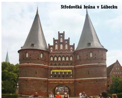
Středověká brána v Lübecku