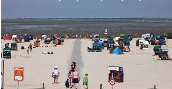
Pláže u mělkého moře, v pozadí východofríský ostrov Spiekeroog

Zachovalou hanzovní architekturu můžete vidět i v menších obchodních městečcích ve vnitrozemí, která se vyhnula bombardování – třeba v Lemgu nebo Lüneburku. MILOŠ KUBÁNEK