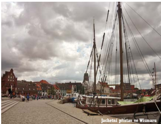
Jachetní přístav ve Wismaru

Časy levných dovolených na Baltu jsou však nená vratné pryč. Vesnice a města na pobřeží si dnes ve zhladu a údržbě nežadají s pobřežím Severního moře a z oblasti se stává německá riviera. Jako všude na Severu, je zde o hodně draž než v jižní Evropě.