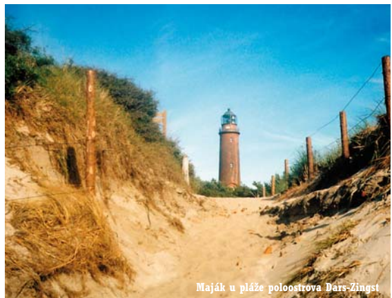
Maják u pláže poloostrova Dars-Zingst

Dolní Moravice, 795 01 Rýmařov Tel: +420 554 254 099, +420 777 742 405 E-mail: recepce.avalanche@seznam.cz www.avalanche-hotel.cz , www.skiareal-avalanche.cz