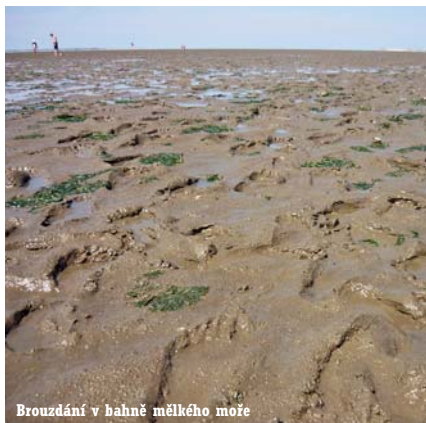
Brouzdání v bahně mělkého moře

ními vodami Severního moře, východní baltické pobřeží Jutského poloostrova má zcela jiný charakter. Nevysoké břehy jsou zde prořezány hlubokými zálivky a fjordy. Ty byly vyhledávány jako kotviště již ve vikingských dobách a přístavy zde najdeme i v současnosti. Jedním z nich je známý velký přístav s loděnicemi Kiel.