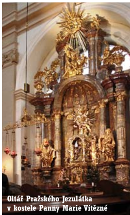
Ortář Pražského jezulátka v kostele Panny Marie Vítězné

„Navrhli jsme téma Po stopách Cyrila a Metoděje za poznáním křesťanských kořenů Evropy, které umožní Českou destinaci diverzifikovat a představit ji z tohoto úhlu pohledu. Naše aktivita jde v linii s připravovaným výročí 1150 let od jejich příchodu, na kterém již pracuje Senát a Česká biskupská konference,“