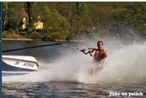
Jízda na patách

Většina naší populace, pokud vůbec holduje aktivnímu pohybu v přírodě, spojuje pojem lyžování jen s běháním na roztočivých prkýnkách, či s tzn. sjezdovými lyžičkami.