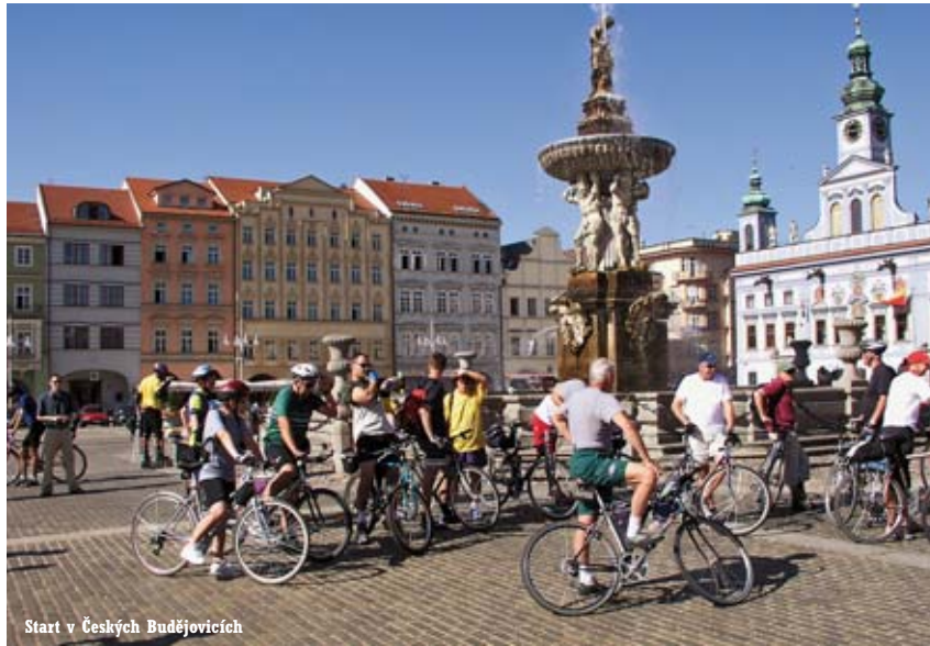
Start v Českých Budějovicích

Třeboňská a Ceskokubějovická pánev je charakteristická třpytivými hladinami rybníků a rybníčků, na Sumavě se setkává spíše s ledovcovými jezery a divokými horskými říčkami. Můžete se vydat také k pramenům řeky Vltavy a sledovat její tok celým regionem. Na