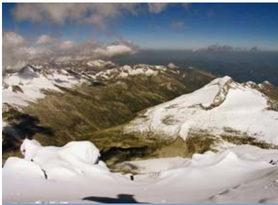
Pohled z vrcholu na sever, do údolí Obersulzbachtal. V pozadí Kitzbühelské Alpy.

Nejtěžším technickým místem je zmíněný vrcholový hřebínek. Je velmi vzdušný, po obou stranách z něj spadají srázy stovky metrů, takže vyžaduje silné nervy. Zvláště za silného větru. I zde