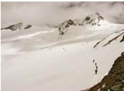
Nástup na ledovec. Vpravo vpředu skalnatý vrchol Rainer Hornu (3559 m).

► I nad 4000 metrů jen málokdy čekat teplo. Změny mohou být rychlé a drsné. Měli byste samozřejmě i znát, jak vaše tělo reaguje na vysokou nadmořskou výšku. Horská nemoc se u něho projevuje už ve 2500 metrech, a to je výška, v níž zde musíte strávit noc. To jsou ovšem celoaalpské vysokohorské konstanty a předpokládám, že se sem nevypraví někdo, jehož nejvyšší zdolanou horou je Říp.