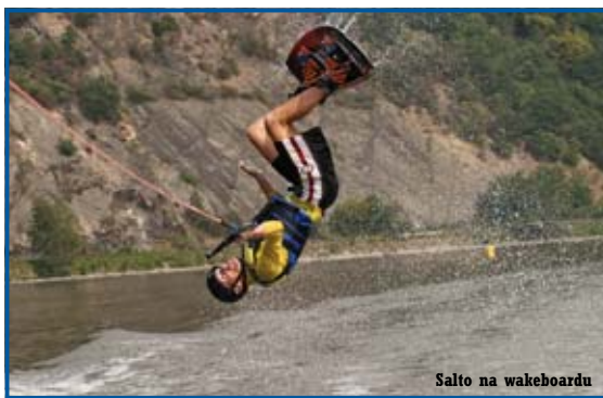
Salto na wakeboardu

Rád bych rozlišil rekreační vodní lyžování a samotné závodní disciplíny, u nás specifikované pravidly Českého svazu vodního lyžování. Jsou tři základní – slalom, figurální jízda a skok. Ve slalomu se hodnotí jízda mezi bójkami ve stanovené rychlosti, která se při opakovaných pokusech pořád zvyšuje. Při figurální jízdě záleží na tom, jak závodník provede jím vybraný cvik, kdy záleží hodně na obratu, skoku, ale i jiných parametrech. Třetí disciplínou je skok, kdy je rozhodující, jak daleko doskočí závodník bez pádu z postavené rampy.