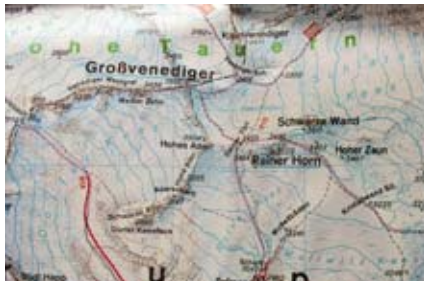
Pohled do mapy Freytag & Berndt. Je zajímavá tím, že uvádí výšku vrcholu 3666 m. Na řadě map a průvodců je uváděno 3674 m.