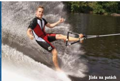
Jízda na patách