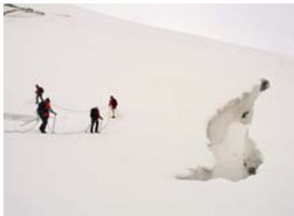
Na ledovci se propíléte mezi řadou trhlin.