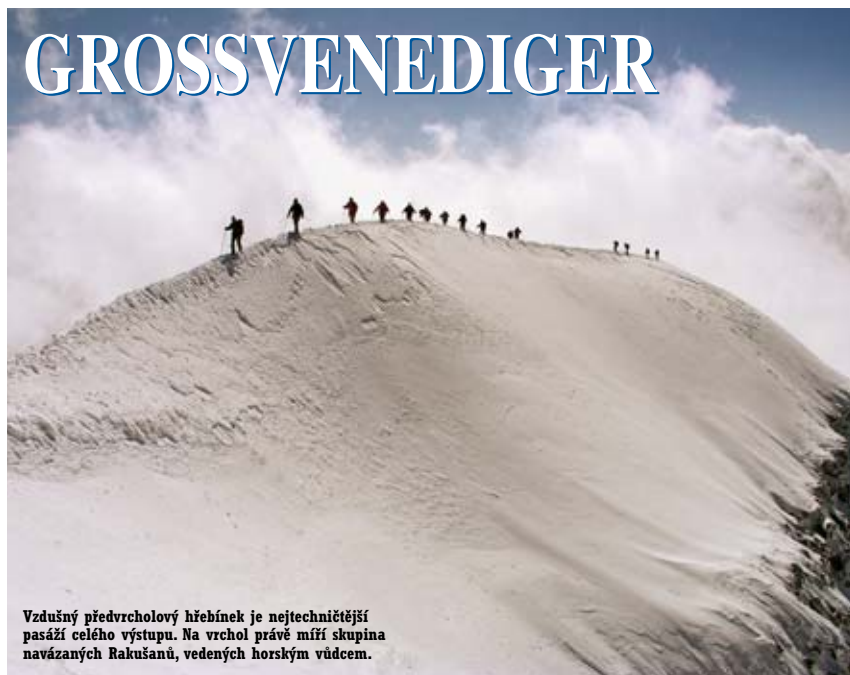
Vzdušný předvrcholový hřebínek je nejtechničtější pasáží celého výstupu. Na vrchol právě míří skupina navázaných Rakušanů, vedených horským vůdcem.

V rakouských Alpách nenajdeme žádné čtyřtisícovky jako ve švýcarských, italských nebo francouzských. Na jejich centrálním hřebeni – především v pohořích Vysoké Taury, Zillertálských, Stubaiských a Ötztálských Alpách – však leží desítky vrcholů výšky