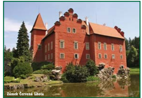
Zámek Červená Lhota

Vltavě leží také největší vodní přehrada v Česku – Lipenská.