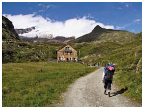
Masív Grossvenedigeru z jihu z údolí Dorftal. V popředí „mezichata“ Johannishütte (2115 m).

Počasí je ve vysokých horách vždy rizikovým faktorem. Ve výšce ko-