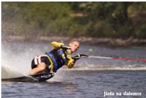
Jízda na slalomce