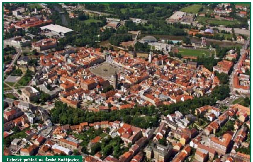
Letecký pohled na České Budějovice