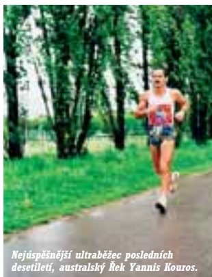
Nejúspěšnější ultraběžec posledních desetiletí, australský Řek Yannis Kouros.

„Pak zkusil uvést do praxe jedno malé a proti ostatním celkem bezvýznamné cvičení, jemuž se při oládvání dechu v Tak-