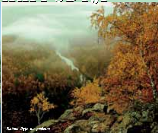
Kaňon Dyje na podzim

Počátek velkoplošné územní ochrany středního toku Dyje se datuje rokem 1978, kdy byla na tomto území vyhlášena CHKO Podýjí. Její větší část byla součástí hraničního pásma a byla tedy turistické veřejnosti nepřístupná. Vzhledem k mimořádným přírodním kvalitám území tu byl pak v roce 1991 zřízen národní park – NP Podýjí (NPP). Je to náš rozlohou nejmenší park, rozkládá se na ploše pouhých 63 km 2 mezi Znojmem a Vranovem nad Dyjí při státní hranici se sousedním Rakouskem (sousedí a úzce spolupracuje s rakouským Národním parkem Thayatal).