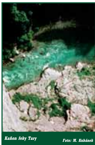
Kaňon řeky Tary