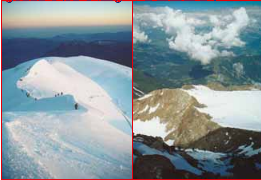
Nahoře: pohled na plato u chaty Tête de Rouse (ta je v levém cípu zasněžené plochy) z výstupu na Refuge du Gouter