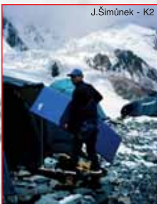
J.Šimůnek - K2

Úspěšně testováno na expedicích K2-2001, Pamír 2001 a mnoha dalších.