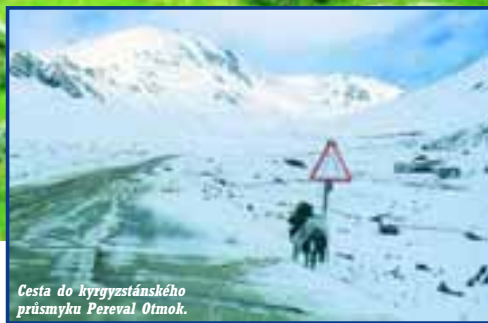
Cesta do Kyrgyzstánského průsmyku Pereval Otmok.