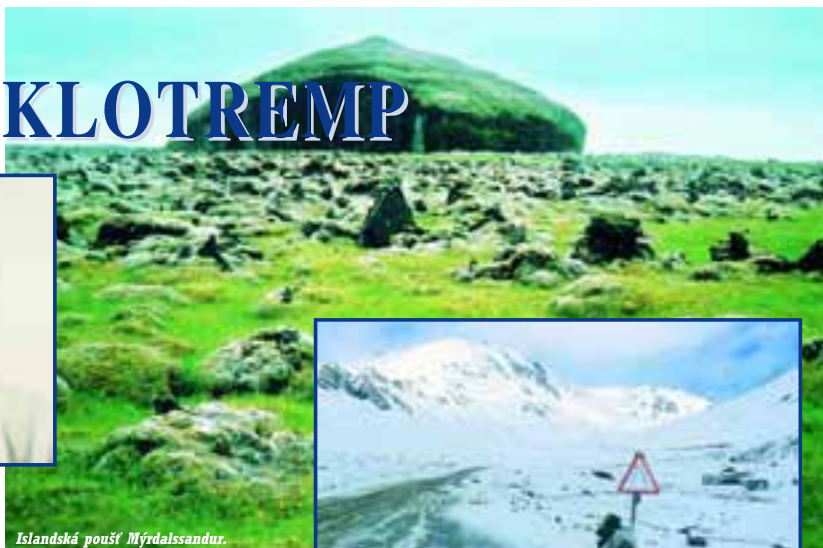
Islandská poušť Mýrdalssandur.