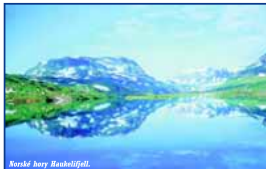
Norské hory Haukelijfjell.

Dost mi pomůžou kamarádi sponzoři z firem REGO a ELKOL od nás ze vsi. Bez nich bych si těžko pořídil nový foták, který jsem nutně potřeboval. (Dík.)