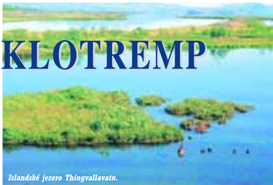
Islandské jezero Thingvallavatn.

Pár peněz mám z prodávání svých knih, další „balík“ (no – spíš balíček) získám prodejem ovoce ze zahrady.