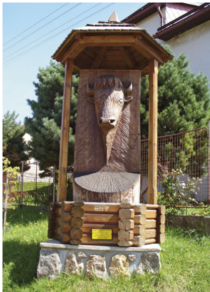
Pomník věnovaný zubrům v obci Zubří