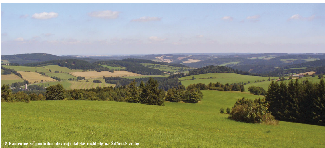
Z Kamenice se poutníku otevírají daleké rozhledy na Žďárské vrchy

Českomoravská vrchovina byla až do počátku 13. století pokryta neproniknutelným hraničním pralesem, který oděloval historické země Čech a Moravy. Neprostupný pomezí hvozď protínaly pouze úzoučké zemské stezky; neznámější z nich – Stezka Žďársko – Libická