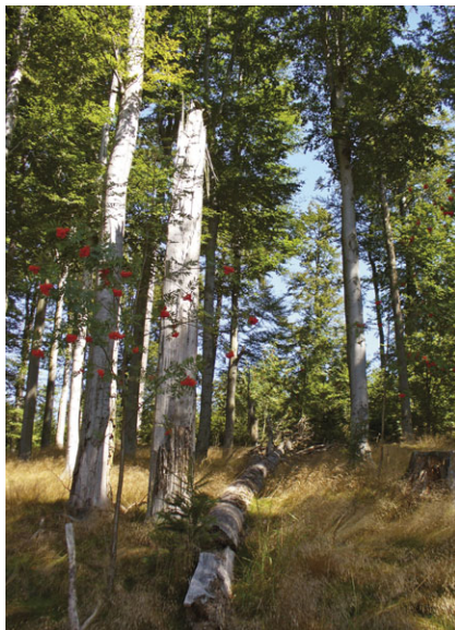
Rezervace Vlčí kámen