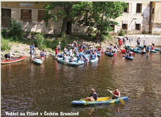
Vodáci na Vltavě v Českém Krumlově

publice. Kraj je doslova protká síť cyklostezek, kvalitně udržovaných turistických tras, bohatou nabídkou mají tradiční vodáci na Vltavě, Lužnici i Otavě, nemluví o Lipenském jezeře. Rozvíjí se i ekoturistika, v zimě jsou pro běžkaře k dispozici neustále se rozšiřující běžecké trasy, zejména na Šumavě i v jejím podhůří, ale i v Novohradských horách a v České Kanadě. Neustále se objevují nové formy outdoorových aktivit. Kraj však má i historické památky, které jsou i v Evropě ojedinělé. Jsou to historické jádro Českého Krumlova, barokní statky v Holašovicích, zařazené do seznamu UNESCO, ale i výjimečně zachovalé městské centrum středověkého charakteru v Prachaticích, rekonstruované náměstí v Českých Budějovicích, zámek Hluboká, Zvíkov, množství rázovitých barokních státek snad v každé vesnici aj. I zhyčkaný návštěvník odkudkoli z Evropy či z jiných kontinentů tu najde to, co jinde ve světě marně hledá, kraj, ze kterého dýchá klid a pohoda.