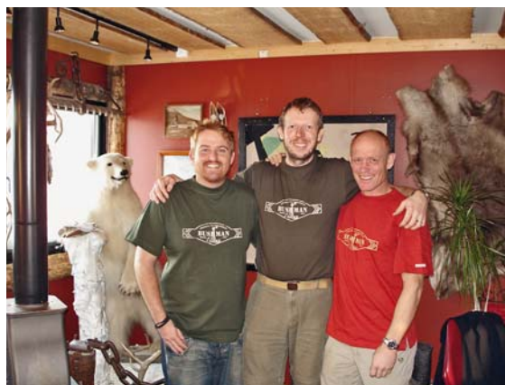
Náš celý tým v Longyru

Celá naše skupina se setkala již v norském Tromsø na letišti, odkud jsme společně odletěli na Špicberky.