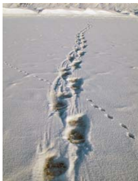
Před chvílí tudy šel vládce severu