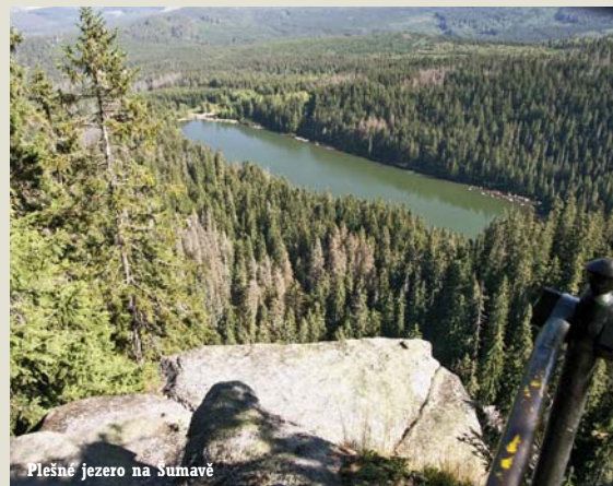
Plesné jezero na Šumavě

Na území kraje se otvírají nové přechody pro turisty. Na hranicích s Rakouskem i Německem povede mimo cyklotrasy Greenway i síť turistických i běžkařských tras, propojených s našimi sousedy. Počítá se i s tím, že Národní park Šumava bude stezkami propojen s Bavorským národním parkem, chystáme i společné propagační materiály a brožury. Naše aktivity lze považovat v oblasti cestovního ruchu za počátek nové, daleko intenzivnější spolupráce než v minulých letech.