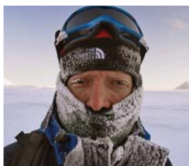
Já během pochodu

Věděl jsem, že cesta bude dosti náročná, a tak jsem potřeboval s sebou dalšího zkušeného parťáka. Nakonec