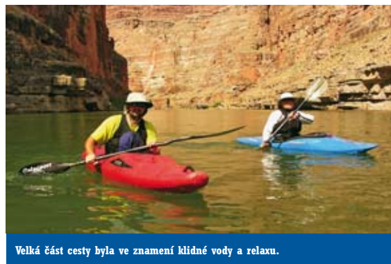
Velká část cesty byla ve znamení klidné vody a relaxu.

Na břehu Grand Canyonu v Lees Ferry se kontroluje absolutně vše, a to kupodivu bez jakékoliv protekce či možnosti úplátku. Poslední hodiny na břehu jsou věnovány několika přednáškám o tom, jak přežít, jak chodit na záchod, jak vařit a jak se celkově v rezervaci pohybovat... Rančer stačí během hodinového povídání na své základně celý tým důkladně vystrašit teoretickým nebezpečím číhající