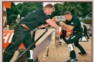
Single buck (fezání pilou)

Všichni, kdo mají rádi napětí, létající třísky a stoupající adrenalin, se mohou těšit na třetí ročník dřevorubecké soutěže STIHL TIMBERSPORTS, která se bude konat 9. července 2006 v kempu Trhový u Orlické přehrady. V šesti tradičních dřevorubeckých disciplínách se utkají ti, kteří nejlépe ovládají práci se sekou a motorovou pilou.