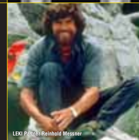
LEKI Pátrník Reinhold Messner

Síla utahování 1,4 Nm* Jistota dotažení 360° Síla držení >140 kg