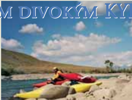
Nástup na Kekemerentu.

Kyrgyzstán (též Kirgizie) zatím nepatří mezi vyhlášené vodácké destinace, kde se potkávají pádlisté z celého světa a o kterých se píše na stránkách vodáckých časopisů. Vzhledem k tomu, co tato středoasijská země pádlistům nabízí, je však zřejmé, že jeho „objevení“ je pouze otázkou času a je velmi pravděpodobné, že již za pár let budou jména Yek Naryn či Kekemerent znít vodákům stejně povědomě jako Sun Kosi, Čoruh či Zambezi.