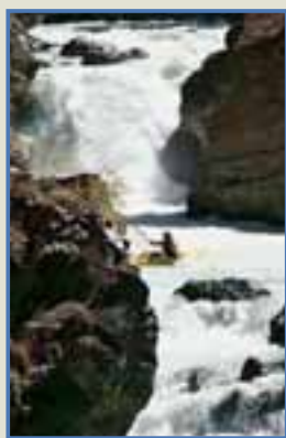
Velký Naryn, peřej 4 rohy.

Text: Ondra Müller redaktor Vodáckého magazínu HYDRO