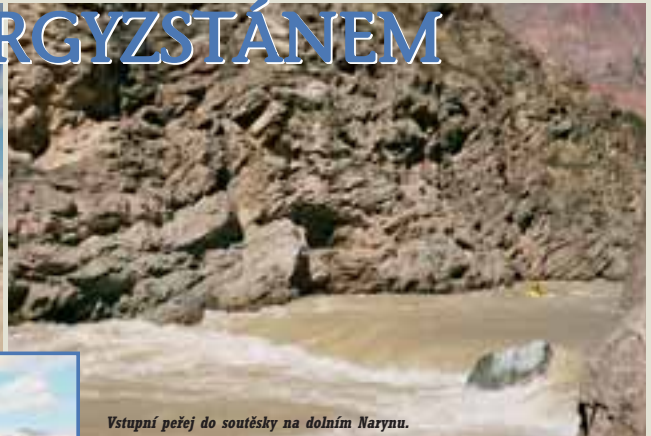
Vstupní peřej do soutěsky na dolním Narynu.

My jsme si pro sebe Kyrgyzstán objevili v nástěnném kalendáři, kde nás zaujala fotografie řeky, jako vystřižené z náhorních oblastí Indie či Nepálu. Tato řeka se však nacházela v zemi, o které jsme sice věděli, že je populární mezi trekaři a horolezci, ale o jejích řekách jsme nikdy předtím neslyšeli.