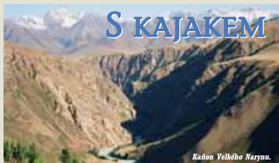
Kaňon Velkého Narynu.