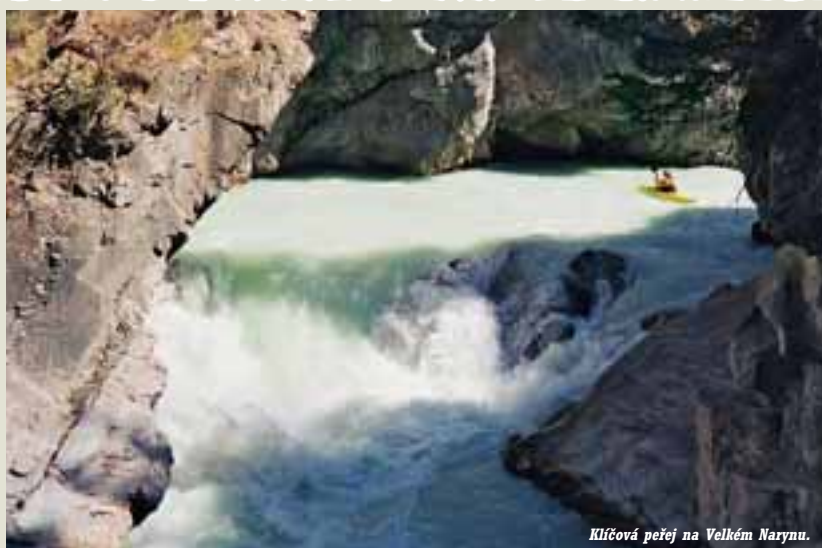
Klíčová peřej na Velkém Narynu.