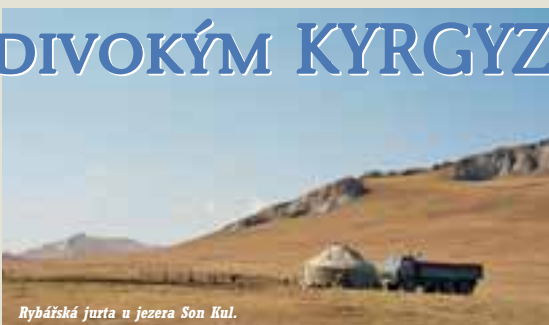
Rybářská jurta u jezera Son Kul.