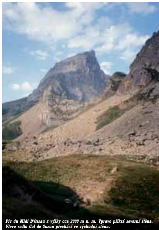
Pic du Midi d'Ossau z výšky cca 2000 m n. m. Vpravo přilhá severní stěna. Vlevo sedlo Col de Suzon přechází ve východní stěnu.