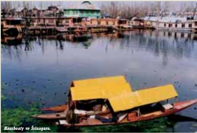
Hausboaty ve Šrinagaru.