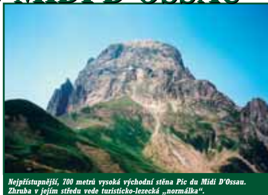
Nejpřístupnější, 700 metrů vysoká východní stěna Pic du Midi d'Ossau. Zhruba v jejím středu vede turisticko-lezecká „normálka“.

Jen zřídka bývá nejvyšší hora pohoří obdivována jako nejkrásnější. Himálaje mají svůj Everest, ale za nejhezčí horu je považován o dva kilometry nižší Ama Dablam, případně podobně vysoká a stavěná Machhapuchhare. V Alpách zase Matterhorn co do věhlasu krásy předčí Mont Blanc. Nejvyšší kopce zkrátka bývají velkými hroudami hmoty, kdežto co do krásy se cení ostré jehlanovité tvary hor, jejichž stěny, a pochopitelně i výšky, jsou ostře obroušeny větrem, ledem a časem.