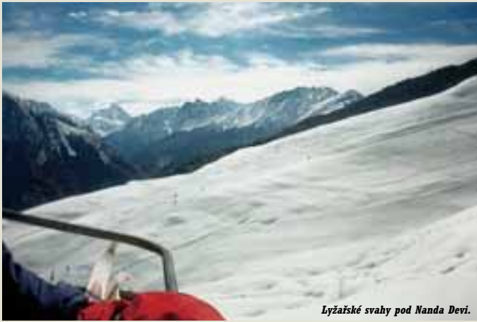
Lyžařské svahy pod Nanda Devi.

➔ sněžení, šťastně jsme objevili „občerstvení“ nad lanovkou, což byla černá kůlna v zemi, plná dýmu z kouřícího ohniště, zapadaná sněhem, kde však měli čaj a sušenky. Pak jsme sjeli hlubokým sněhem a lesem dolů do chaty, kde mne vůdce naposledy učešal a vypil poslední kašmírský čaj zvaný kava... Vyměnili jsme si čepice – on mi dal svou zmljovku a já jemu kulicha s norským vzorem.