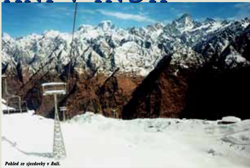
Pohled ze sjezdovky v Auli.