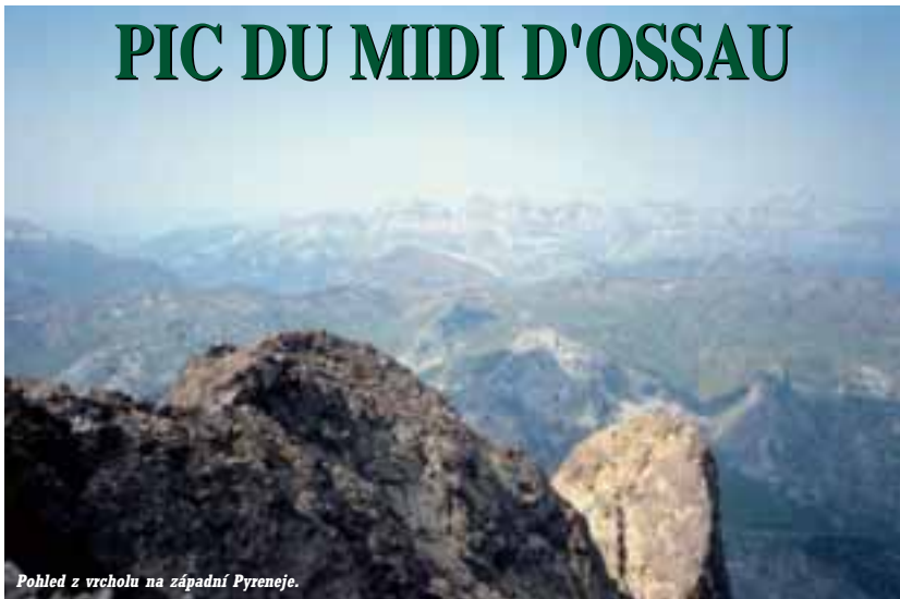
Pohled z vrcholu na západní Pyrenee.