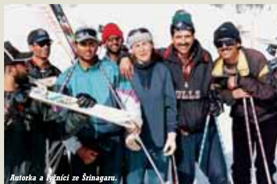
Autorka a lyžaři ze Šrinagaru.