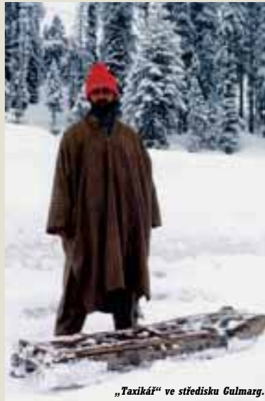
„Taxikář“ ve středisku Gulmarg.

Ráno se stal zázrak! Azuro, metřík prašánku a nádherný jasný výhled na sedmitsicovku Nanda Devi. Jako v pohádce! Po tzv. několikaproudé zevrubné konverzaci s mistřími na téma půjčení lyží jsme si nakonec vyšlápli kopec a úspěšně si půjčili v hotelové půjčovně sjezdovky i s botami, a to ve slušném stavu. Šrouby na vázání nám sice dotahovali na maximum, nehledě na váhu, ale vlastní šroubovák vše napravil. Vyškrábali jsme se vzhůru ke kratšímu vleku, co měl údajně jezdit jako první (tedy dříve než sedačková lanovka) od deseti hodin. Jelikož jsme si platili jednotlivé jízdy, měli jsme právo volně předbíhat účastníky kursů, proti čemuž jsme neprotestovali. Byli bychom náramně spokojeni, nebyť částých „tea pauz“ a vypínání vleku z různých důvodů. Vyrazili jsme samozřejmě i na lákavý delší a prudší svah pod vedlejší sedačkovou lanovkou, s hlubokým prašením, avšak byli jsme při druhé jízdě důrazně vyhozeni, že jim tam nemůžeme jezdit a „ničtí sjezdovku“, dokud to není urolované – a to do večera neby-