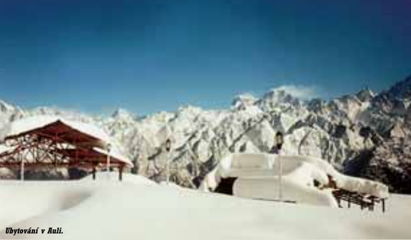
Ubytování v Auli.