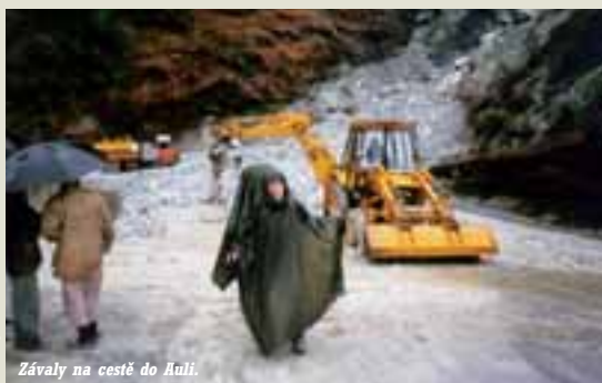
Závaly na cestě do Huli.