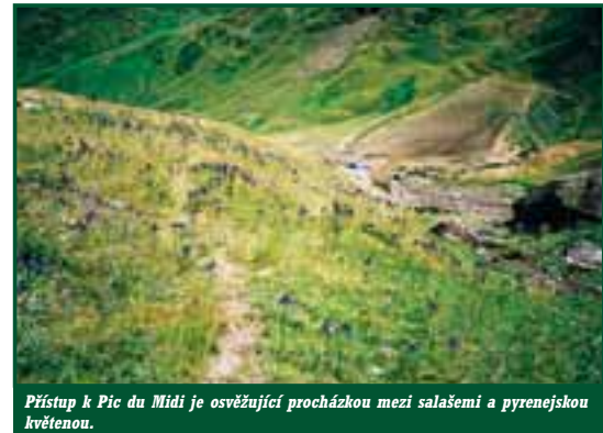
Přístup k Pic du Midi je osvěžující procházkou mezi salašemi a pyrenejkou květenou.

Pic du Midi má dva vrcholy, nás bude zajímat ten skutečný – vyšší a masivnější. Na něj vede samozřejmě řada lezeckých cest i v kolmé severní a jižní stěně. My ale asi půjdeme „normálkou“, která vede od sedla Col de Suzon (2127 m), nejpřístupnější východní stě-