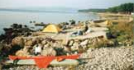
Punatská zátoka (nahore), tábořiště u města Krk (dole)