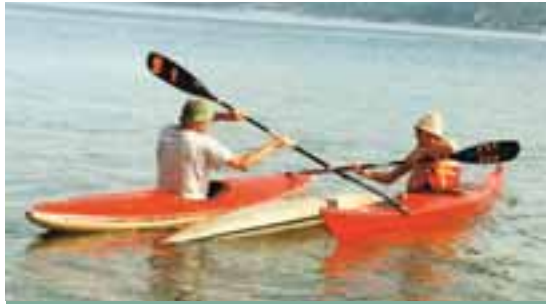
Návlek eskymáckého obratu

Je už šero a čtyři kilometry vzdálená světla Bašky se v této situaci zdají nesažitelná. Ochladilo se, kajaky se zafézavají do zelených stěn a pádla se snaží udržet kontakt s vodou. Hrábnutí do vzduchu se opakuje stále častěji a je docela dobrým důvodem ke zvrhnutí. Zprava se řítí dvoumetrová vlna, hodí lodku dolů do hlubiny, na všech stranách se zvedají masy vod s bílými hřebeny, ale kupodivu se nic jiného neděje. Je to vůbec našim usilovným pádlováním nebo by všechno proběhlo i s prázdnou lodkou? Chůf experimentovat je ovšem mizivá a každý, jak se ukázalo, raději pádloval usilovně dál.