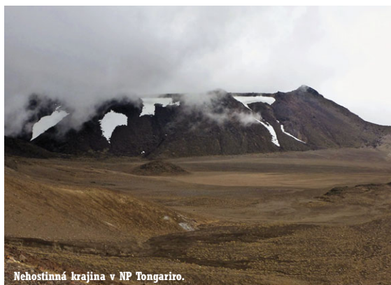
Nehostinná krajina v NP Tongariro.