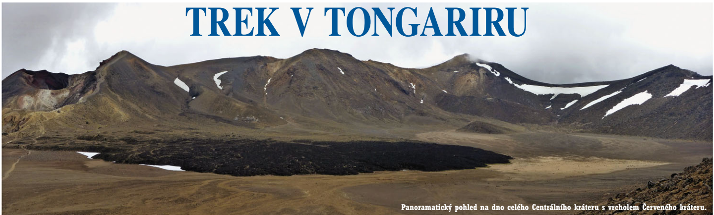
Panoramatický pohled na dno celého Centrálního kráteru s vrcholem Červeného kráteru.