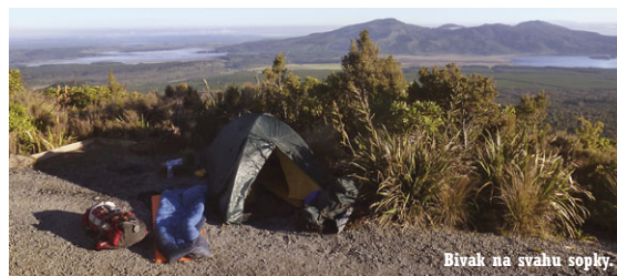
Bivač na svahu sopky.

myšlenku na ponoření se do ledových vod Modrého jezera. Modrá obloha už zas tak modrá není a změnila se na pověstnou šedočernou směs mraků a mlhy a okamžitě se citelně ochladilo. Vulkán Mount Ngauruhoe (2291 m n. m.), známý také pod názvem Mount Doom, čili Hora Osudu, nám tak během pouhých několika minut mizí z dohledu. Místo obdivování tohoto archetypu sopečné činnosti a dominanty celého NP Tongariro tak nyní zíráme do mlhy. Uchováme si však naději, že se mraky rozeženou stejně rychle jako se objevily a my tak nepřijedeme o možnost Mt. Ngauruhoe slézt a nahlédnout do nitra jeho pověstného kráteru.