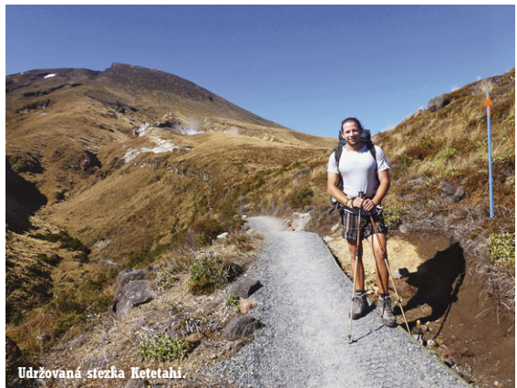
Udržovaná stezka Ketetahi.