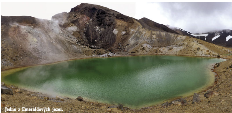
Jedno z Emeraldových jezer.