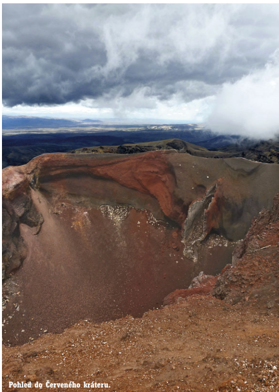
Pohled do Červeného kráteru.

Nejstarší novozélandský národní park Tongariro je nejenom úchvatnou krajinou sestávající z tučtu vulkánů, krystalicky čistých sopečných jezer či nehostinných lávových polí, z jejichž puklin stoupá sírná pára. NP Tongariro je ve skutečnosti jenom zlomkem toho, co se v odborné mluvě nazývá supervulkánem. Už samotné slovo supervulkán zajisté nevěstí nic dobrého. Jeho erupce může totiž kdykoliv v budoucnosti zničit podstatnou část novozélandského severního ostrova. A dle vědců se nejedná o otázku zdali, ale kdy. I zemská kůra je v této oblasti místy jen 300 m tlustá.