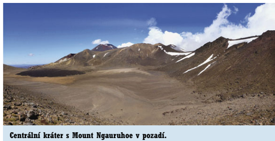
Centrální kráter s Mount Ngauruhoe v pozadí.