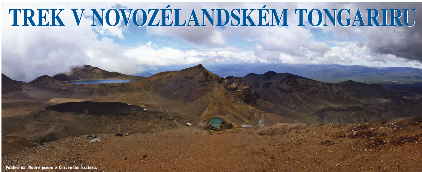
Pohled na Modré jezero z Červeného kráteru.

Nejstarší novozélandský národní park Tongariro je nejenom úchvatnou krajinou sestávající z tučtu vulkánů, krystalicky čistých sopečných jezer či nehostinných lávových polí, z jejichž puklin stoupá sírná pára. NP Tongariro je ve skutečnosti jenom zlomkem toho, co se v odborné mluvě nazývá supervulkánem. Už samotné slovo supervulkán zajisté nevěstí nic dobrého. Jeho erupce může totiž kdykoliv v budoucnosti zničit podstatnou část novozélandského severního ostrova. A dle vědců se nejedná o otázku zdali, ale kdy. I zemská kůra je v této oblasti místy jen 300 m tlustá.