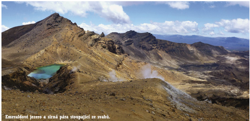
Emeraldové jezero a sírná pára stoupající ze svahů.