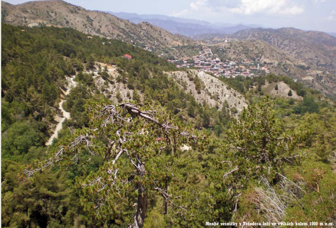
Mnohé vesničky v Tróodosu leží ve výškách kolem 1000 m n. m.