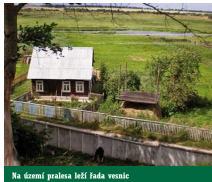
Na území pralesa leží řada vesnic

Martyrium vlastního přechodu se pak zahajuje už na polské straně hranic. Při příjezdu k ní totiž uvidíte dlouhou řadu vozidel, které jsou pomalým tempem vypouštěny do pohraničního prostoru. Jedná se hlavně o Bělorusy a Poláky. ➤