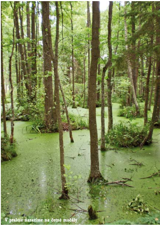
V pralesě narazíme na četné močály