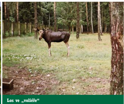
Los ve „voliery“