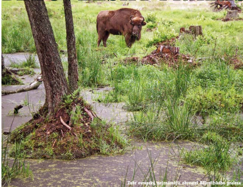
Zuhr evropský, nejnámější obyvatel Bělověžského pralesa

Pokud chcete vidět, jak vypadaly smíšené lesy v nížinách severní Evropy před osmi sty lety, pak návštěva Bělověžského pralesa je asi tou nejlepší volbou. Prales, který byl vyhlášen chráněnou památkou UNESCO v roce 1992, se rozkládá kolem polsko-běloruské hranice asi 200 kilometrů východně od Varšavy. Jeho polská část je dobře dostupná po státnice vedoucí z Varšavy do Bialystoku (a poté na jih až do vesničky Hajnówka, která je vstupní branou do polské části pralesa). Prales je dnes ovšem rozdělen téměř železnou oponou polsko-běloruských hranic, a tak není možné procházet obě jeho oddělené části najednou. O polské části pralesa a zdejším národním parku jsme přinesli podrobnou reportáž v č. 8/2005 Dobrodruha. V tomto čísle se budeme věnovat jeho větší, avšak zároveň složitěji dostupné běloruské části.