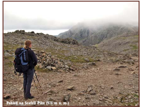
Pohled na Scafell Pike (978 m n. m.)

Po půlhodině rozjímání a konverzace s Ronem se vydáváme na sestup. Prostupujeme chuchvalcem oblaků a mlhy, které se zrovna přes Scafell Pike poměrně vysokou rychlostí valí. Zjišťujeme, že čas ubíhl poněkud rychleji, než jsme předpokládali, a tak měníme původní plán sestupu a přes