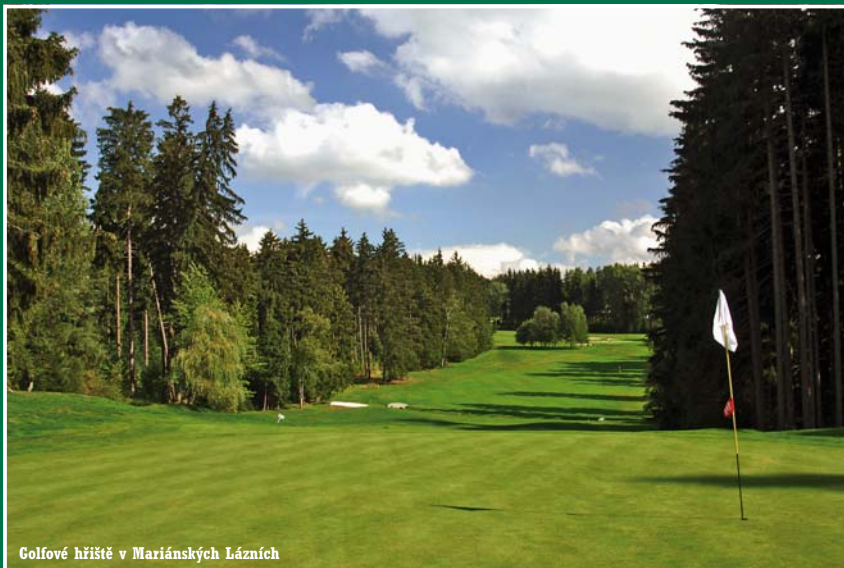
Golfové hřiště v Mariánských Lázních