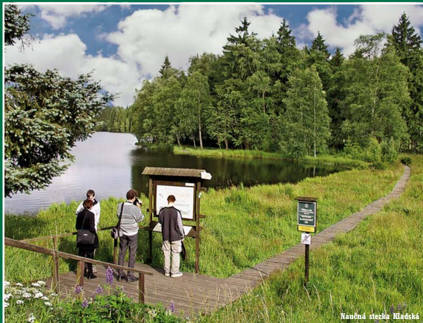
Naučná stezka Kladská

mostických aktivit. Od Chebu až po Klášterec nad Ohří se jedná o téměř 120 km říčního toku, jež je splavný po celé své délce a díky množství klidných i náročnějších úseků činí její splavování velice atraktivní. Na levém břehu řeky Ohře, asi 8 km jihozápadně od Karlových Varů, se pak nachází oblíbená horolezecká oblast Svatošské skály. Tento přírodní výtvor, jež svými tvary připomíná svatební procesi, je součástí Chráněné krajinné oblasti Slavkovský les. Další nepřilhlá tradiční, avšak rychle se rozvíjející outdoorovou aktivitou je hipoturistika. V současné době je k dispozici zhruba 100 km vyznačených hipostezeček v okolí Toužimka, o které se starají místní farmáři a rančeři, u nichž je také možné půjčit si koně pro putování krajinou. S průvodci a jejich vycvičenými koňmi se setkáte například