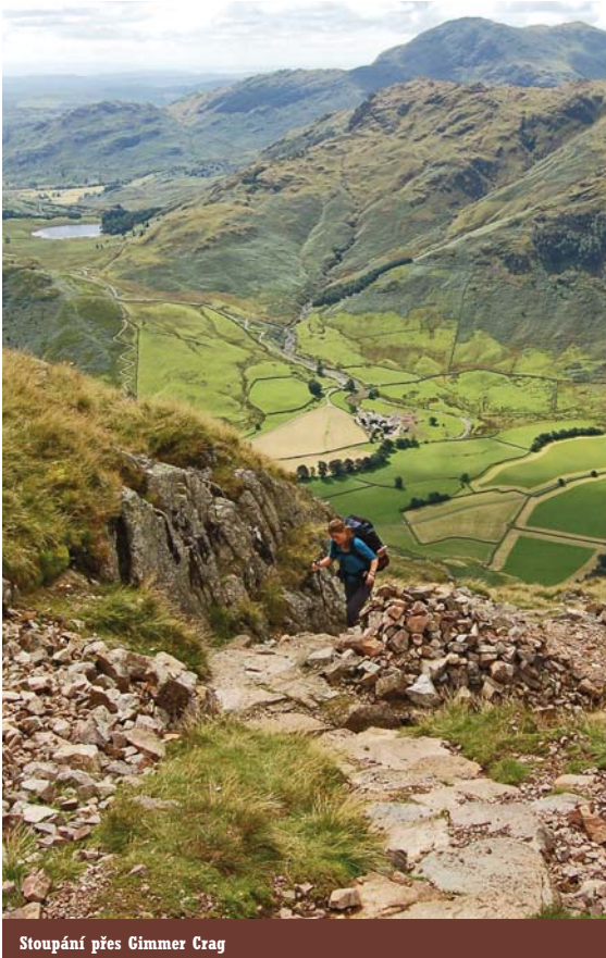
Stoupání přes Gimmer Crag