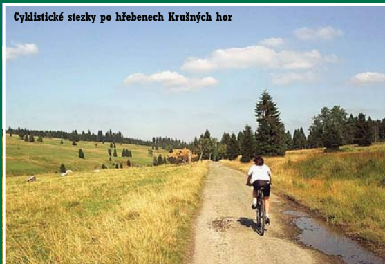
Cyklistické stezky po hřebenech Krušných hor