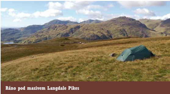
Ráno pod masivem Langdale Pikes