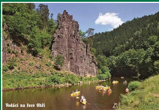
Vodáci na řece Ohří

mější patří například rozhledna na Klínovci, Plešivci nebo rozhledna u obce Krásno. Více jak 1000 kilometrů značených cyklistických tras nasvědčuje tomu, že i tento populární sport má v našem kraji velké množství příznivců a zároveň skvělé podmínky. Jelikož se v současné době jedná již o poměrně hustou síť cyklostezek, vydal v loňském roce Karlovarský kraj velice podrobnou cyklomapu, jež je k dostání ve všech infocentrech v regionu. Stejným způsobem je distribuována publikace „Vodácká stezka na řece Ohří“, jež je bezesporu velice užitečným průvodcem a pomocníkem všem, kteří vodáckému sportu propadli a chtějí si jej užít i při pobytu v nejzápadnějším kraji naší republiky. Řeka Ohře protíná celý Karlovarský kraj a nabízí tak vodákům k vidění řadu jeho tu-