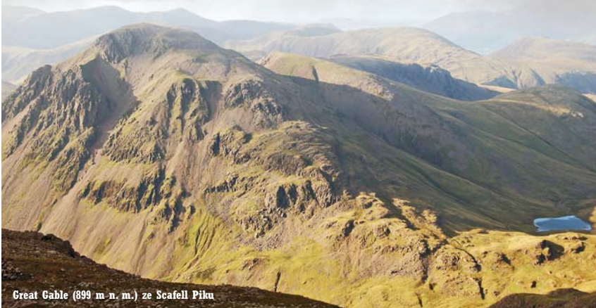
Great Gable (899 m n. m.) ze Scafell Piku