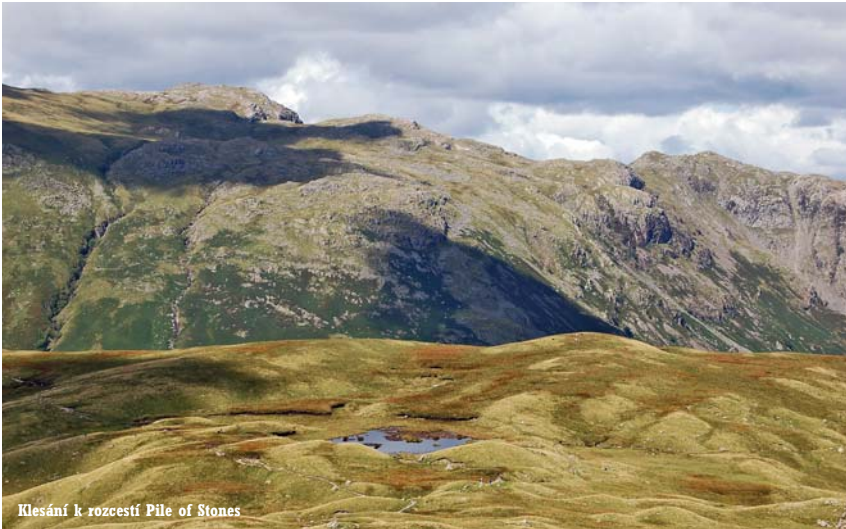
Klesání k rozcestí Pile of Stones