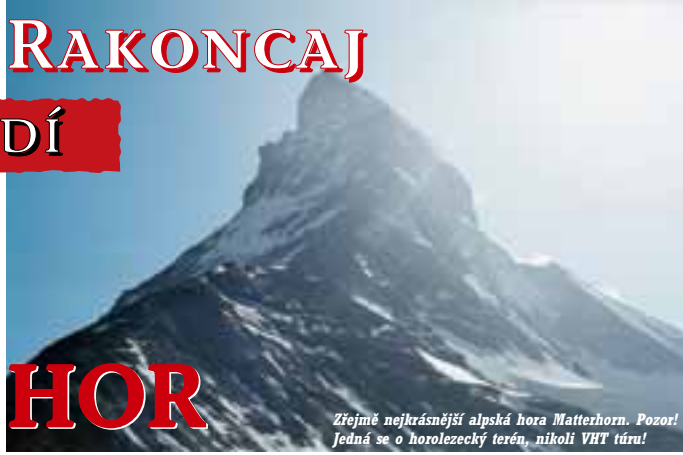
Zřejmě nejkrásnější alpská hora Matterhorn. Pozor! Jedná se o horolezecký terén, nikoli VHT túru!