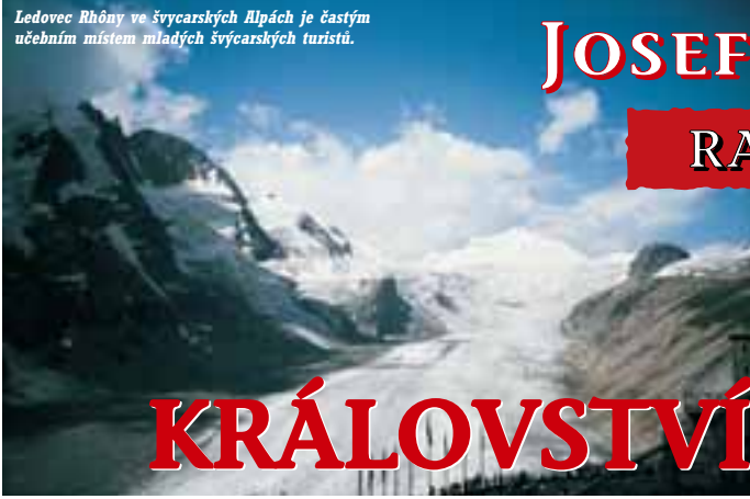
Ledovec Rhôny ve švýcarských Alpách je častým učebním místem mladých švýcarských turistů.