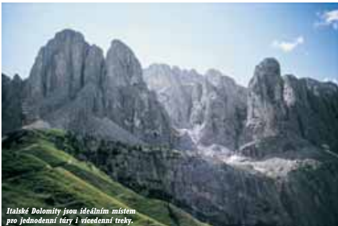
Italské Dolomity jsou ideálním místem pro jednodenní túry i vícedenní trek.