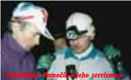
Funkelnický Vomocil a jeho servisman.