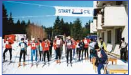
Start je v pohodě.