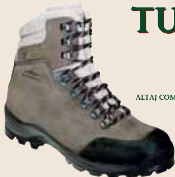
ALTAJ COMTEC S 01654 – 012

Uvádíme jenom pár základních doporučení, protože v každé specializované prodejně Vám jistě odborně poradí se vším, co je nezbytné vědět, aby Vám obuv sloužila k úplné spokojenosti.