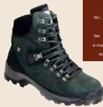
CONDOR COMTEC S 90557 – 010

boty přirozeně vyschnout. V žádném případě je nepokládejte na topná tělesa, nebo blízko ohně. Praskliny, které by na kůži vznikly, se již nedají