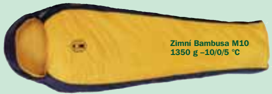
Zimní Bambusa M10 1350 g -10/0/5^{\circ}\text{C}

miniaturní rozměry ve sbaleném stavu ( 37 \times 19 cm). Ty lze ještě zmenšit použitím kompresních popruhů, které jsou součástí transportního obalu. Samozřejmostí je krycí léga zipu, stahovací kapuce a zateplovací límec kolem ramen. Tak jako všechny spacíky Coleman, se dodává ve variantě s levým a pravým zipem, je tedy vždy možné spojit dva spacíky dohromady. Zimní Bambusa M10 se vyrábí v elegantní přírodní pískové barvě nebo módní kombinaci hořčičová/modrá.