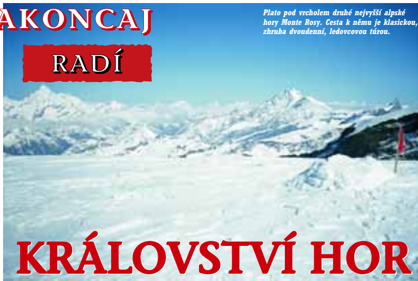
Plato pod vrcholem druhé nejvyšší alpské hory Monte Rosy. Cesta k němu je klasickou, zhruba dvoudenní, ledovcovou túrou.

Pokud sebou nevláčíte stan, tak je v evropských horách nejlepší přenočovat v horských chatách. Tady by si měl vůdce zajistit noceh už předem telefonicky. To je velmi důležité. Chaty nejsou tak velké, některé bývají i pro pár osob. Prosil mě třeba kamarád z chaty Gouter pod Mont Blancem, abych tady vyřídil, aby si naši lidé ověřili, jestli je chata volná a budou v ní moci přespat při svém vý-