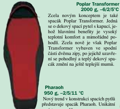
Poplar Transformer 2000 g, -6/2/5^{\circ}\text{C}