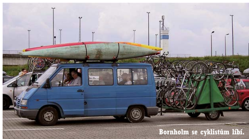
Bornholm se cyklistům líbí.

Dny jsou o prázdninách dlouhé, ale stejně jednou končí. Na Bornholmu se nabízí mimo jiné k přenocování Lejrsplads, něco jako tábořiště. Bývá to třeba loučka v lese, uprostřed pařez, ohniště a sekera na řetízku. Někdy dokonce hadice s tekoucí studenou vodou a jindy je komfort doplněn rýčem a šipkou směrem do křoví. Všechno probíhá automaticky, bez zbytečných debat