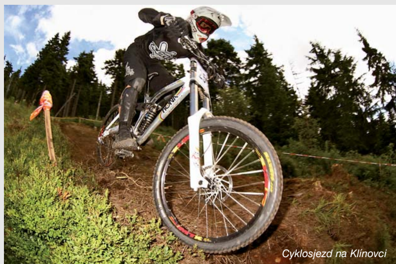
Cyklosjezd na Klínovci