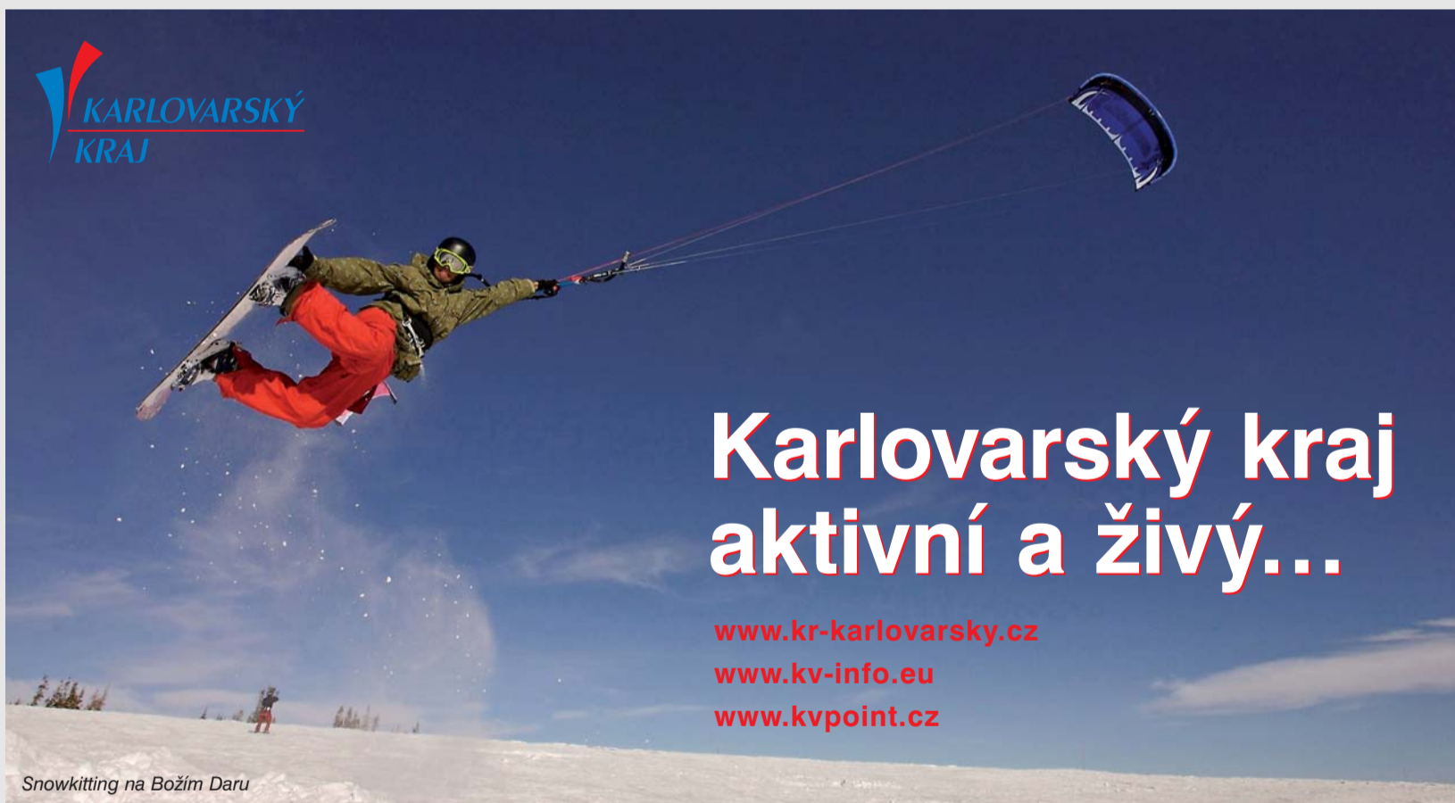
Snowkiting na Božím Daru

Pro milovníky zimních sportů jsou každoročně připraveny desítky kilometrů sjezdových a běžeckých tratí, snowboardové parky, U-rampy a ideální podmínky pro snowkiting. Karlovarský kraj rovněž hostí významné kulturní a společenské akce, z nichž nejznámější je světově proslulý Mezinárodní filmový festival, ovšem nezapomenutelný zážitek nabízí například také koncerty v přírodním amfiteátru v Lokti s výhledem na středověký hrad, kulturní akce na koupališti Michal u Sokolova, či Valdštejnské slavnosti v Chebu.