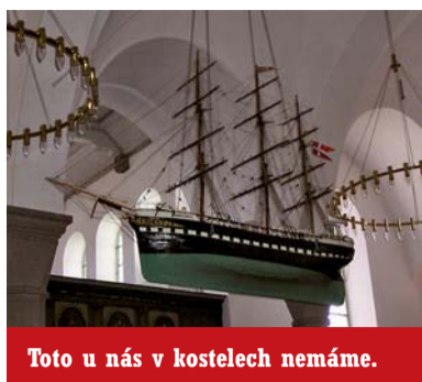
Toto u nás v kostelech nemáme.

Vůně mouky v lánech zrajícího obilí se během vteřin mění ve vlhký závan studeného lesa a stejně rychle ve slanou rybí příchut nekonečného příboje. Stejně tak neomylně vnímá cyklista tyto tři odlišné Bornholmy sluchem a může se zamýšlet nad tím, kdy a proč se stal ostrov ostrovem a ještě k tomu ostrovem napůl skandinávským a napůl patřícím k evropské pevnině. Na to už je potřeba otevřít oči a přehlédnout