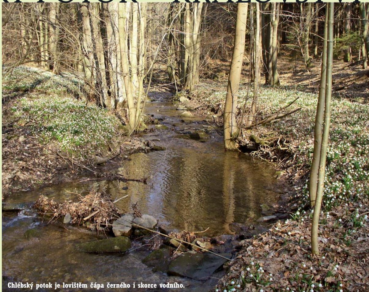
Chlébský potok je lovištěm čápa černého i skorce vodního.

Chlébský potok, který se nad Nedvědicemi vlévá do řeky Svratky, je lemován břehovým porostem, který je tvořen olší lepkavou ( Aldus glutinosa ), jasanem ztepilým ( Fraxinus excelsior ) a javorem mléčcem ( Acer platanoides ). Na kmenech stromů jsou hojné epifytické rostoucí mechory (např. rožeňka dutolistá – Lejeunea cavifolia , sobík chlumní – Orthodicranum montanum , podhořanka plocholístá – Madotheca platyphylla ,