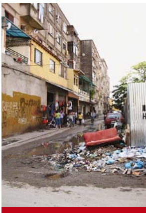
Symbióza obchůdků a odpadků