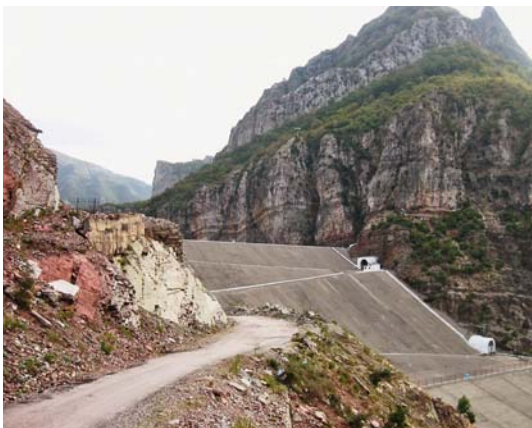
Přehrada „Světlo strany“