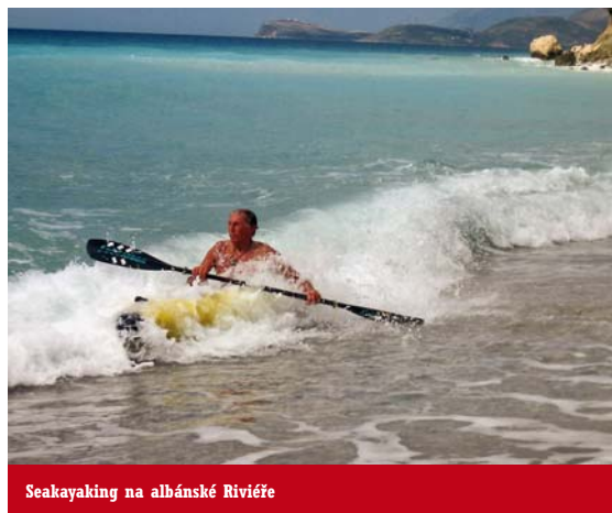
Seakayaking na albánské Riviere

Jinak ovšem skoro třitisícové kopce, divoké kaňony, modré moře a pozůstatky dávných věků nabídnou historicky mladšímu středoevropskému suchozemci z rovin a pahorků zážitky nevsední, které si se zatajeným dechem horlivě uloží do paměti elektronických médií, anebo jen tak, do své vlastní paměti. Už mapa napoví, že pohyb v albánské krajině nebude jednotvárnou procházkou, ale naopak plný překvapení a možná i trapného ponížení rádo by zkušených matadorů.