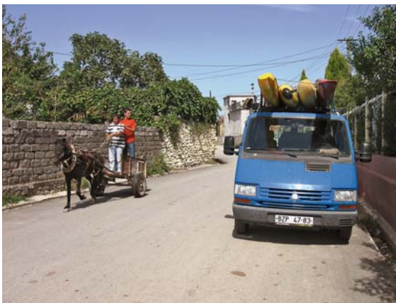
Máme víc koní