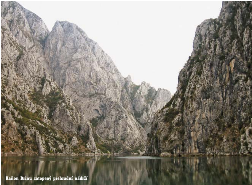
Kaňon Drinu zatopený přehradní nádrží