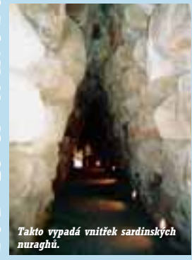
Takto vypadá vnitřek sardinských nuraghů.