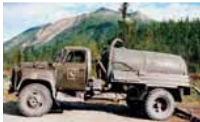
Fekální auto – „hovnocuc“, se kterým pracoval jeden kluk ve vesničce Razvilka. Vesnice má 100 stálých obyvatel a nachází se na trase Chandyga–Magadan. Plat tohoto kluka byl 10 R na hodinu