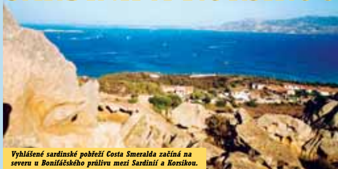
Vyhlášené sardinské pobřeží Costa Smeralda začíná na severu u Bonifáckého průlivu mezi Sardinii a Korsikou.

Sardinie i severněji položená Korsika patří k evropským outdoorovým stálicím, a tak není divu, že autobusové výpravy na ně jsou již řadu let pevnou součástí nabídky řady dobrodružněji orientovaných cestovních kancelářů. Pro řadu dobrodruhů není cestování s cestovkou právě to pravé, na druhé straně mnozí jiní oceňují jeho nesporné výhody – ušetření peněz, času, mnohdy i nervů, a v případě dobré konstelace možnost společenského vyžití. Náš redaktor Milan Manda se loni na takovou cestu vydal a přináší několik postřehů o tom, co na ní lze vidět i na co se lze při tomto způsobu cestování těšit a čeho se vyvarovat.