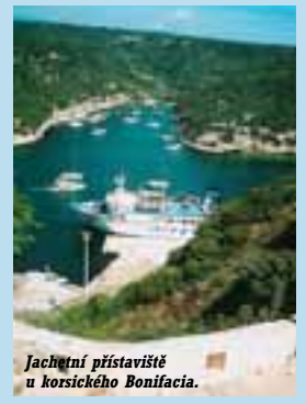
Jachtní přístaviště u korsického Bonifacia.