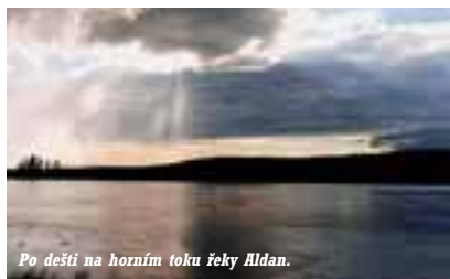
Po dešti na horním toku řeky Aldan.