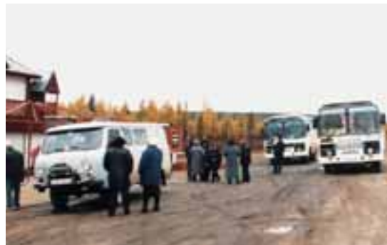
Zastávka, odpočívadlo pro kamiony a autobusy na magistralé vedoucí z poslední zastávky na vlakové Bajkalsko-Ďumské magistralé (Tynda) do hlavního města Jakutsk. V této jižní části jakutské republiky byl místy na cestách i asfalt.

Bez víza do Ruska nelze. Jsou dvě možnosti. Ideální je dostat od ruských přátel pozvání nutné k vyřízení víza. Buď v Praze na ambasádě, nebo lépe v Brně na konzulátu. Vyřízení víza trvá týden až čtrnáct dní. Druhá, delší trávající a o něco