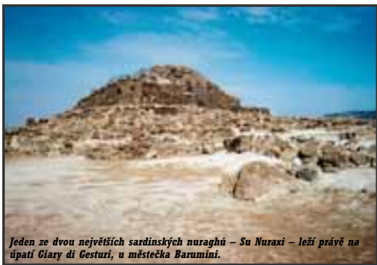
Jeden ze dvou největších sardinských nuraghů – Su Nuraxi – leží právě na úpatí Giary di Gesturi, u městečka Barumini.

Nicméně, co muselo přijít, přišlo. Na počátku 60. let koupil šejk Aga Khan Karim pozemky asi na 50 kilometrech nádherného pobřeží Costa Smeralda („Smaragdové pobřeží“ dle barvy vstupek ostrůvků) na severu Sardinie a postupně zde vystavěl řadu věhlasných monděnních letovisek. Další jej následovali, a tak pobřeží Sardinie bylo léty obestavěno hotely a celkem vkusnými turistickými vesničkami stylu lidového stavitelství a dnes se v letních měsících nijak neliší od dalších vyhlášených turistických oblastí. Jsou zde statisíce turistů, přeplněné kempy a hotely, nepřetržitě noční diskotéky, dopravní jamy na pobřežních silničkách, doplněné bláznivými motorkovými a mopედovými jízdami (a častými bouřáčkami) italské rozjařené mládeže. Pobřeží v letních měsících, a zvláště v srpnu, kdy mají Italové centrálně stanovenou dovolenou, není tedy vůbec tím pravým místem pro poznávací a dobrodružně-outdoorové cestování. Rozsáhlé vnitrozemí ostrova však i v létě zůstává takřka bez turistů a najdete zde řadu míst, kde se zastavil čas.