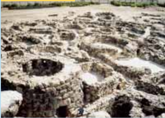
Pozůstatky starověké megalitické vesnice Su Nuraxi na Sardinii.

To se týká samozřejmě i potravin, kdy je nadto jejich trvanlivost v horkém podnebí velice problematická. Na co