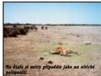
Na Giare si místy připadáte jako na africké poloúští.

Přestože se na Sardinii v historických dobách vystřídal v moci řada národů – mj. Feničané, Řekové, Kartaginci, Římané, Arabové, Pisánci a Janované, Španělé, Francouzi či Italové, nenajdeme zde prakticky žádnou kulturní památku, svým významem srovnatelnou se skvosty okolních pevnin. Až na jednu výjimku, která je opět raritou. Jsou jí zvláštní kamenné pevnosti, které vznikaly zhruba od r. 1800 do roku 250 př. n. l. a mají souhrnný název nuraghy. Odhaduje se, že jich je na Sardinii kolem 7000. Z většiny z nich dnes zbyly hromady kamenů (jako ostatně z valné části řeckých a římských památek ve Středomoří), ale několik desítek větších zůstalo zachováno, bylo restaurováno a dnes právem přitahuje turisty a obdivovatele starověku. Klasický nuragh vypadá zdá-li jako obla hromada velkých, nahrubo opracovaných