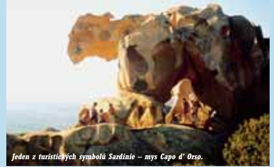
Jeden z turistických symbolů Sardinie – mys Capo d' Orso.

vsak určité nezapomeňte, jsou nádoby, lahve na vodu. Vedro vás doslova nutí pít i zteplanou vodu v kempech, proto je dobré vzít třeba šumáky, nebo pikslu s multivitaminy. Na spaní stačí i sešité deky, v kvalitním spacáku je vám neúnosné vedro. Ve stanech lze přespávat i bez svrchní vrstvy, karimatky jsou vzhledem k někdý hrbolatému terénu v horských kempech nezbytné. Jen je nepokládejte na palubu trajektů, která bývá často mastná od olejí. Také kladívko a ocelové hřebíky o délce 15 cm, místo hliníkových stanových kolíků, se při stavbě stanu velice hodí. Na oblečení stačí pár triček, kratasy a sandály, do hor a skalnatého terénu běžná trekkingová obuv. Nepodceňujte ani krémy proti slunci, různé léky a náplasti proti odfením vám také určitě pomohou při zdravotních potížích. I když bylo na místech, kde jsme nocovali, komárů málo, vezměte si proti těmto trapičům nějaký vhodný přípravek.