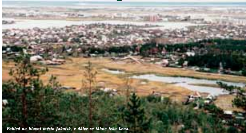
Pohled na hlavní město Jakutsk, v dálce se táhne řeka Lena.