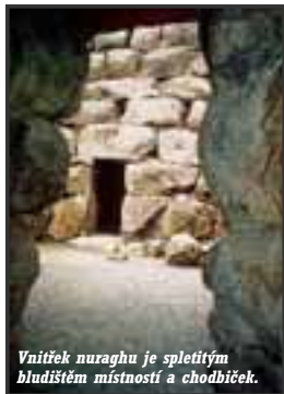
Vnitřek nuraghu je spletitým bludištěm místností a chodbiček.