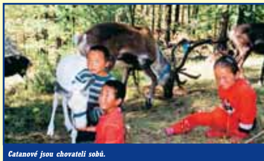
Catanové jsou chovateli sobů.