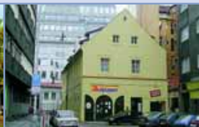
Nová prodejna v Praze 1, v Lodecké ulici č. 4, na rohu Petřského náměstí.