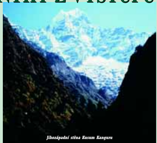
Jihozápadní stěna Kusum Kanguru