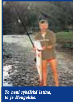
To není rybářská latina, to je Mongolsko.

kou vodáckou expedici, kterou naši vodáci do Mongolska podnikli v roce 1978.