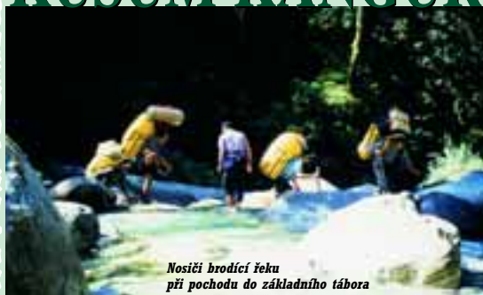
Nosiči brodí řeku při pochodu do základního tábora

S tudený pot pomalu stékající po zádech, otevřená pusa a vyfřetěné oči. To byly naše pocity ve vesnici Thada Koshi, kousek od Lukly v údolí Solo Khumbu, v Nepálu. Po několika týdnech příprav jsme konečně stáli pod jihozápadní stěnou strmého a hrozivě vypadajícího masivu, pod Kusum Kanguru.