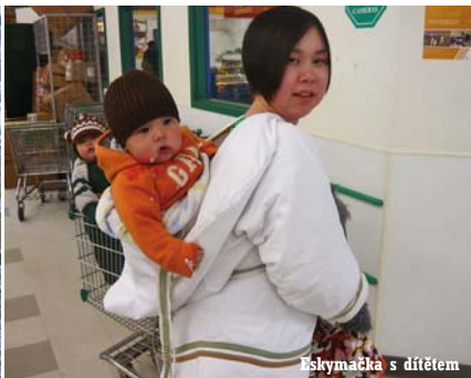
Řeklymačka s dítětem