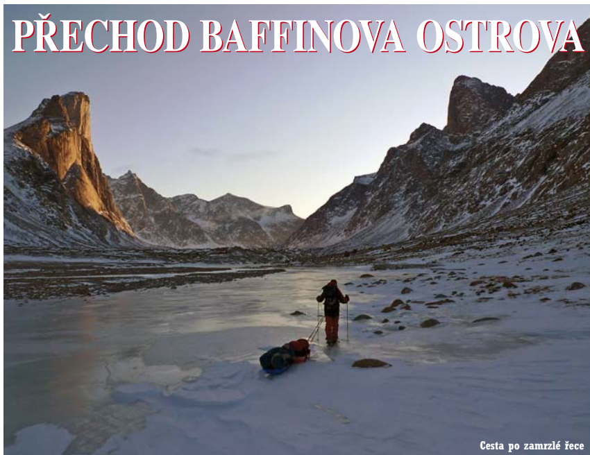
Cesta po zamrzlé řece