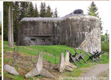
Dělostřelecká tvrz Skutina