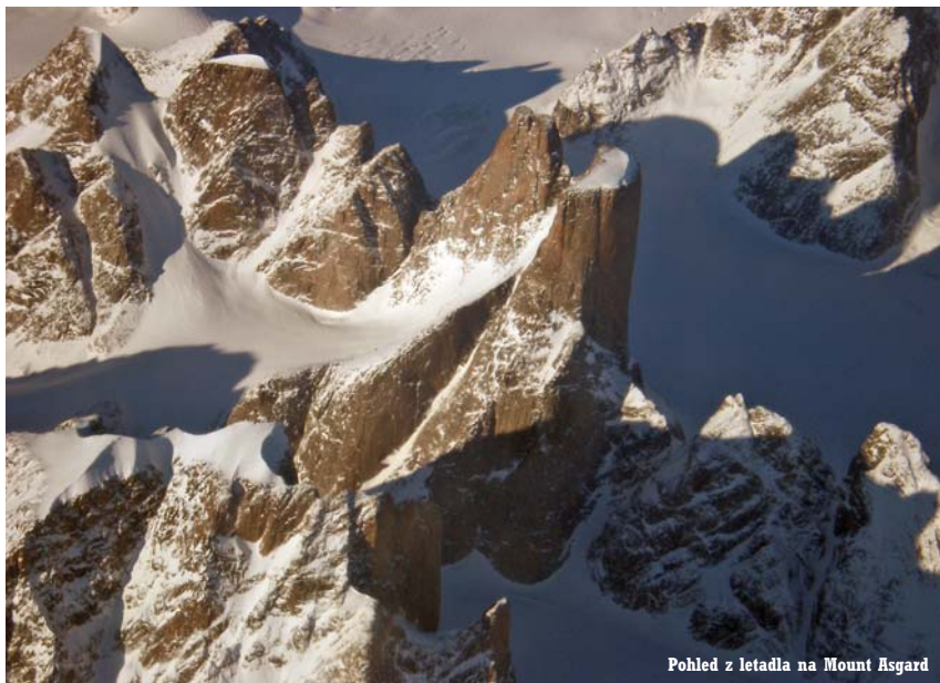
Pohled z letadla na Mount Asgard

Na severovýchodě Kanady se nachází Baffinův ostrov. Rozlohou 507 500 km 2 se řadí na páté místo na světě. Administrativně spadá do inuitské provincie Nunavut. Z přibližně 14 000 obyvatel tvoří 85% Inuité neboli Eskymáci.