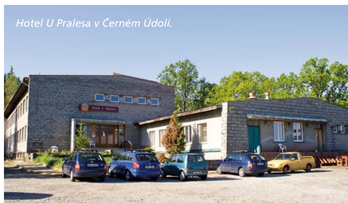
Hotel U Pralesy v Černém Údolí.