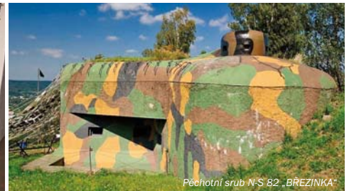
Pěchotní srub N-S 82 „BŘEZINKA“