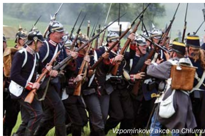
Vzpomínkové akce na Chlumu

Projekt je spolufinancován z prostředků ERDF prostřednictvím Euroregionu Glacensis