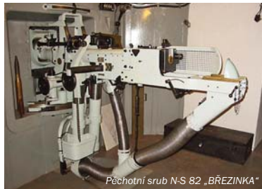
Pěchotní srub N-S 82 „BŘEZINKA“