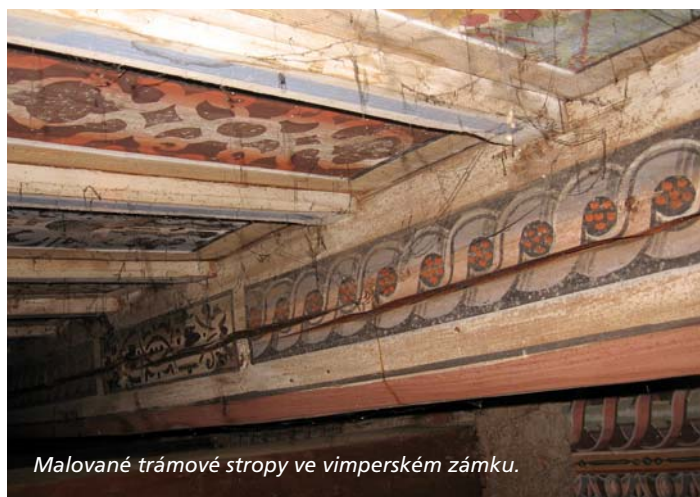
Malované trámové stropy ve vimperském zámku.