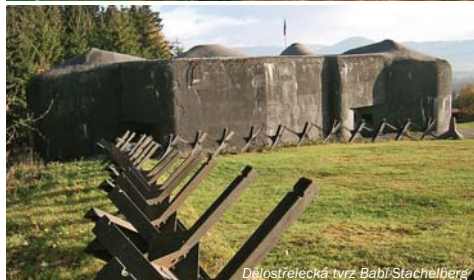
Dělostřelecká tvrz Babí-Stachelberg