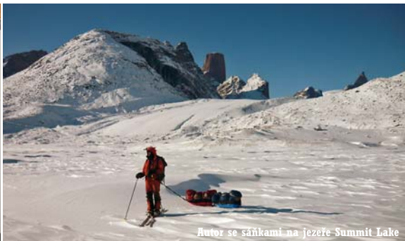
Autor se sánkami na jezeře Summit Lake

a říček. Hned první den jsme v jednom z nich zlomili plastové boby. Nezbylo, než dojít do záchrané chatky, kde jsme je během noci provizorně opravili šňůrou. Kupodivu vydržely až do konce.