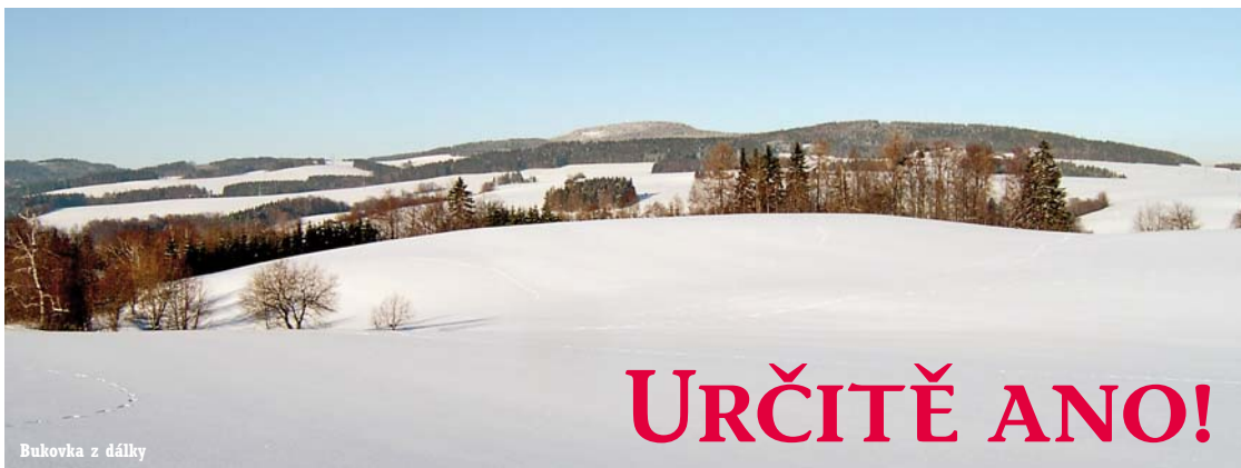
Bukovka z dálky