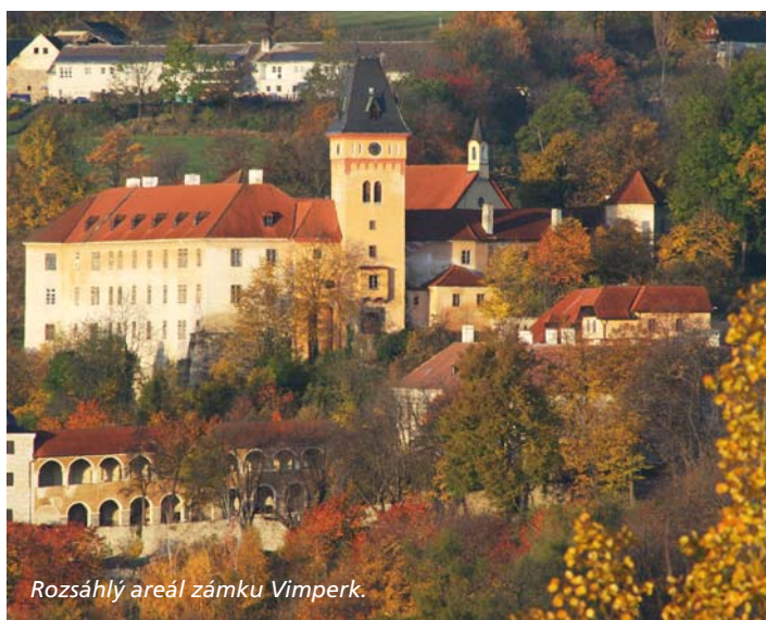
Rozsáhlý areál zámku Vimperk.

ského pracoviště spolupracujících s vysokými školami a univerzitami v ČR i ve světě vznikají podmínky např. pro pořádání konferencí a akcí mezinárodního, národního, resortního nebo nadregionálního významu, a v této návaznosti je možno podstatně ovlivnit rozvoj služeb města a okolních obcí. Zámek a zahrady mohou také velmi dobře sloužit k relaxaci a odpočinku, představení starých řemesel a technologií všem věkovým kategoriím návštěvníků.