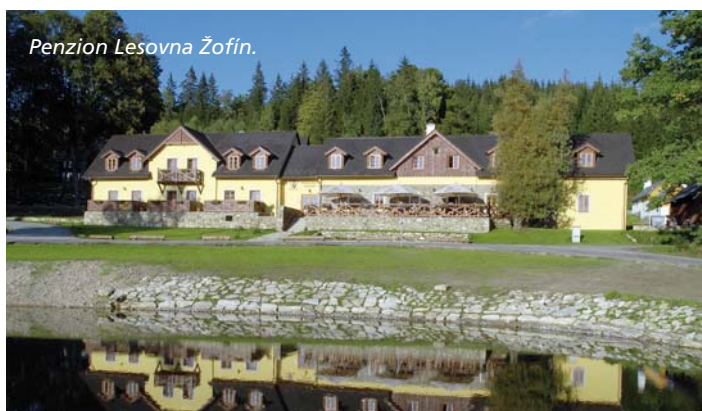
Penzion Lesovna Žofín.