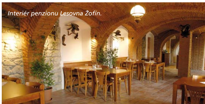
Interiér penzionu Lesovna Žofín.

V nejjižnějším koutu České republiky, v nadmořské výšce 860 m, se nachází další objekt, kterému nadšení majitelů a nemalá investice opět vdechly život. Místem jako stvořeným pro rodinnou dovolenou, či romantický víkend spojený se sportovním využitím je rodinný penzion Baronův most. Objekt penzionu je zrekonstruovaná bývalá hájovna tehdejší správy místního polesí Lužnice. Hájovna byla postavena v místě vaziště vorů po roce 1780 při úpravě koryta Pohořského potoka. Penzion je ukryt mezi nádhernými lesy Novohradských hor, s výhledem na jejich druhý nejvyšší vrchol Myslivna (1040m). Asi 4 km od penzionu se nachází obec Pohoří na Šumavě, ke které se váže dlouhá historie. Kousek dál je nově otevřený hraniční přechod do Rakouska pro pěší, cyklisty a lyžaře. Díky novému přechodu je možné navštívit skutečný pramen řeky Lužnice. V létě je k dispozici koupání v kilometru vzdálené rašelinné „Jiříčské nádrži“, dále pak krásné trasy pro pěší túry i cykloturistiku. Půvab zasněžené zimní krajiny je pak možné poznávat pěšky nebo na běžkách.