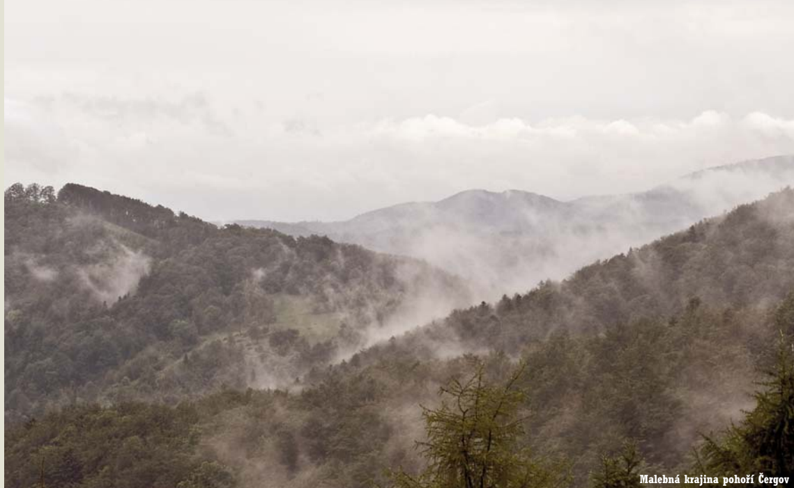
Malebná krajina pohoří Čergov