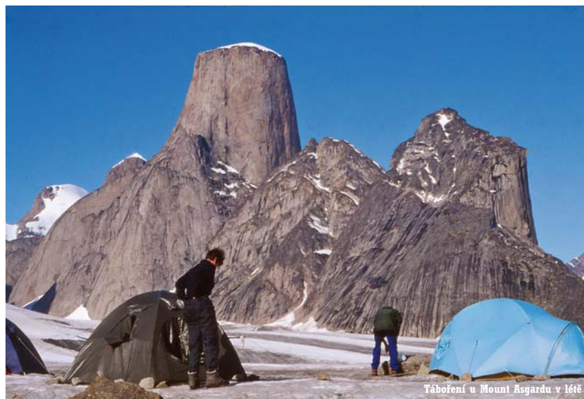
Táboření u Mount Asgardu v létě

Po návratu na jezero jsme pokračovali dále v nejistotě, zda další úsek projdeme. Ještě v Qikiqtarjuaqu nám jeden z Inuitů vylíčil cestu dosti chmurně. Mluvil o jakési vodě, strženém mostu a dalších nebezpečích. Moc jsme mu nevěřili, vždyť