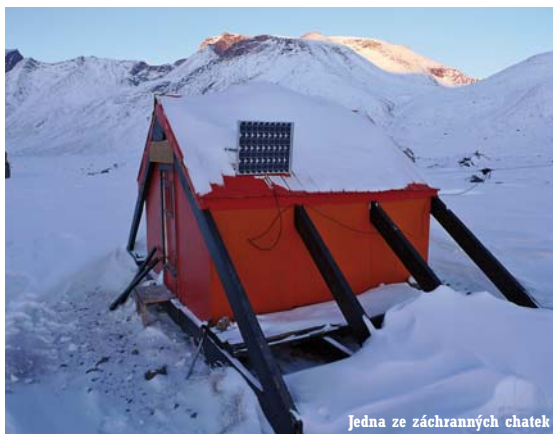
Jedna ze záchraných chatek

stupných břehů. Ale koryto bylo našetřeno zamrzlé a částečně pokryté sněhem, takže se nám podařilo sestoupit k chatce Windy, ležící blízko polárního kruhu. Bylo pozdě, když jsme přesně na polárním kruhu postavili stan. Teď už bylo jasné, že do Pangnirtungu dojdeme.