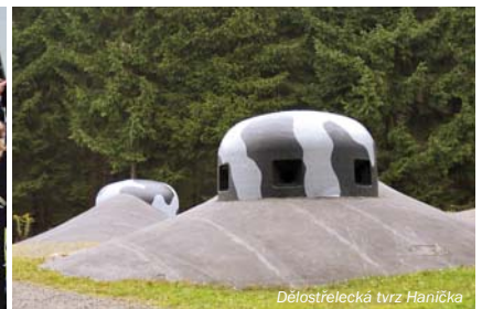
Dělostřelecká tvrz Hanička