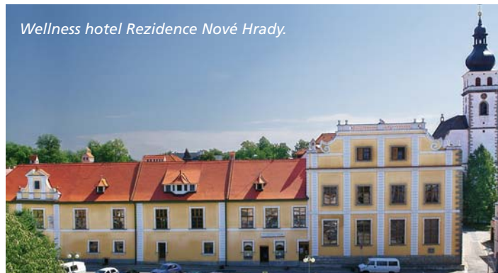
Wellness hotel Rezidence Nové Hradce.

Dalším využitým brownfielDEM je hotel U Pralesy v Černém Údolí v Novohradských horách. Jedná se o nově zrekonstruovanou pohraniční rotu o kapacitě 76 lůžek asi 8 km od Benešova nad Černou. Hotel se nachází přímo v srdci Novohradských Hor mezi Kraví horou, Vysokou horou a horou Království Divočiny. Najdete zde čisté ovzduší, nedočetnou přírodu a nejstarší evropský prales „Žofínský prales“, koupání v přírodní čisté vodě v rybníce Zlatá Ktiš, vzdáleném 2 km od ubytování. Dále se zde můžete sportovně vyžít nekonečnými projíždkami na kolech nebo na kolečkových bruslích, v zimě na běžkách. Na své si přijdou i milovníci pěší turistiky. Hotel se nezaměřuje jen na rekreanty, ale díky salonku o kapacitě 30 míst, je zde