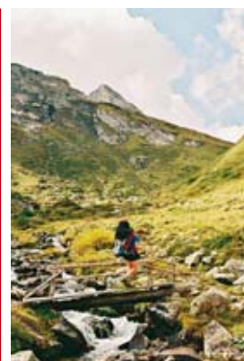
1. den – výstup údolím Pöllatal (Ankogelgruppe)

Další den pokračujeme po Tauern Höhenweg se zastávkou asi po 3 hodinách na Hagener Hütte, která je zřejmě poslední den otevřená a plná lidí. Tady se loučíme se skupinou Ankogelu a vstupujeme do části Taur proslavené těžbou zlata. Přes sedlo Feldseescharte (2712), kde odpočíváme u plechového Weiberberova bivaku, se dostáváme po dalších 5 nekonečných hodinách v suti na již zavřenou Duisburger Hütte. Bývalý winterraum, přeměněný na skladiště, je otevřený, a tak se ubytováváme zde. V objektu vodárny nabíráme rezavou vodu a ve fungující elektrické zásuvce necháváme dobít mobil. V míze a šeru působí okolí chaty i lanovka na Mölltalergleitstschere poněkud depresivně. Také ráno se všude kolem převálují mraky. Začínáme sestupem po sjezdovce k přehradě Hochwurtenspeicher a zahříváme se následným výstupem do