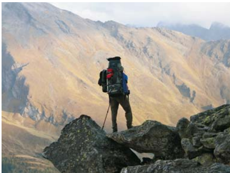
3. den – podvečer na Göttinger Weg cestou k Mindener Hütte (Ankogelgruppe)